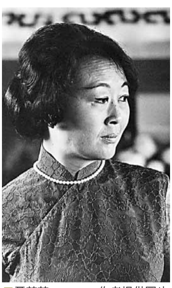
聶華苓 作者提供圖片

嬌小而堅毅不拔的女人——聶華苓。正因為這個玲瓏的女人與一個德裔詩人保羅·安格爾在一個小城，邂逅相愛，所激發的澎湃的活力，共同成就一番震古爍今的文學事業。