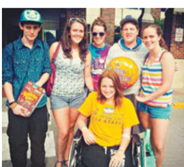
評判讚謝潑德眼神及笑容攝人。