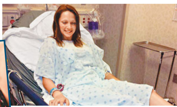
在美當義工時突中風入院。