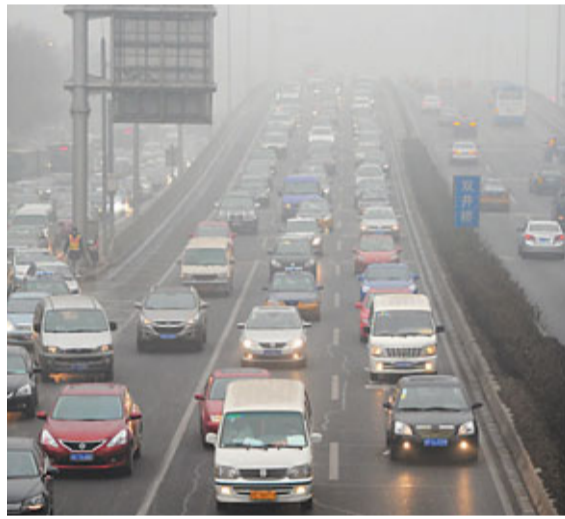
北京東三環雙井橋上的汽車昨日在濃霧中打開車燈緩慢行駛。