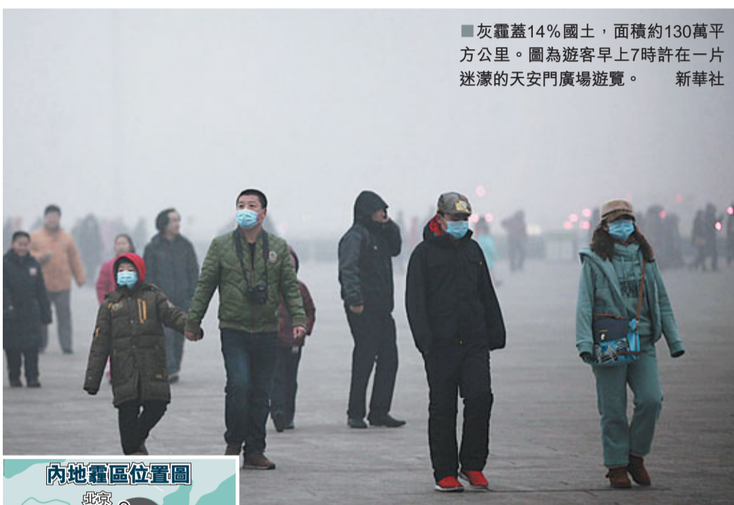
灰霾蓋14%國土，面積約130萬平方公里。圖為遊客早上7時許在一片迷濛的天安門廣場遊覽。

針對燃煤污染，在確保安全供暖、保障市民生活的基礎上，北京市、區兩級環保部門加強對燃煤電廠、燃煤供熱鍋爐的執法檢查，供暖單位要採取降低生產負荷、提高脫硫、脫硝、除塵設施運行效率等措施，進一步降低污染排放。