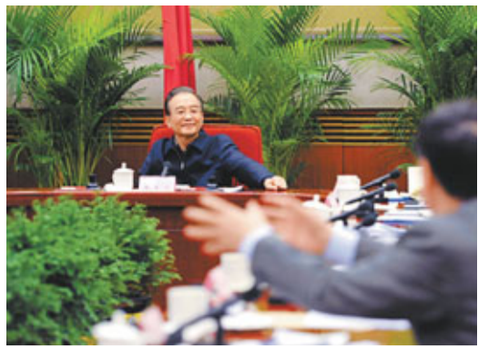
溫家寶表示，將加快推進產業結構和佈局調整，推進節能減排，建設生態文明。圖為其日前於座談會中。