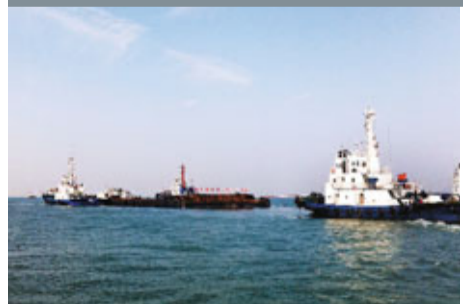
島隧項目部調用15艘船舶編組成隊，真實模擬沉管浮運、繫泊的施工過程。

香港文匯報訊 (記者 張廣珍 珠海報道) 港珠澳大橋的控制性工程——島隧工程正順利推進，將於春節後開始首個沉管浮運安裝。28、29日，島隧項目部調用15艘船舶編組成隊，真實模擬沉管浮運、繫泊的施工過程，旨在熟悉浮運線路、浮運軟件的操作方法、增強操作熟練性，為首節沉管的浮運安裝提供依據。據介紹，這是港珠澳大橋建設以來最大規模的單次船舶演練作業。