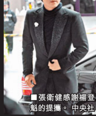
▲張衛健感謝楊登魁的提攜。