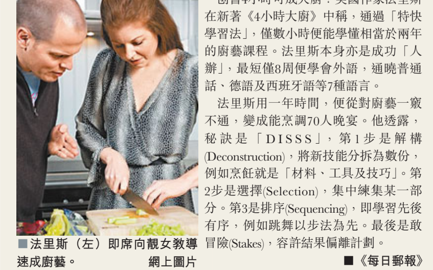
法里斯(左)即席向觀女教導速成廚藝。

創書4小時成大廚?美國作家法里斯在新著《4小時大廚》中稱，通過「特快學習法」，僅數小時便能學懂相當於兩年的廚藝課程。法里斯本身亦是成功「人辦」，最短僅8周便學會外語，通曉普通話、德語及西班牙語等7種語言。法里斯用一年時間，便從對廚藝一竅不通，變成能烹調70人晚宴。他透露，秘訣是「DISSS」，第1步是解構(Deconstruction)，將新技能分拆為數份，例如烹飪就是「材料、工具及技巧」。第2步是選擇(Selection)，集中練集某一部分。第3是排序(Sequencing)，即學習先後有序，例如跳舞以步法為先。最後是敢冒險(Stakes)，容許結果偏離計劃。