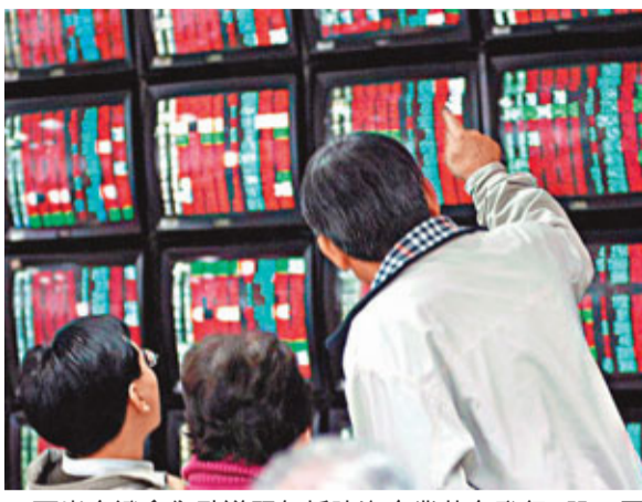
兩岸金證會焦點議題包括陸資企業赴台發行T股。圖為某交易所一隅。

此外，台灣也在希望爭取大陸提高QFII(合格境外機構投資者)給台資金融機構的額度；同時金管會也正研擬提高大陸QDII來台投資額度，從目前5億美元擴大到