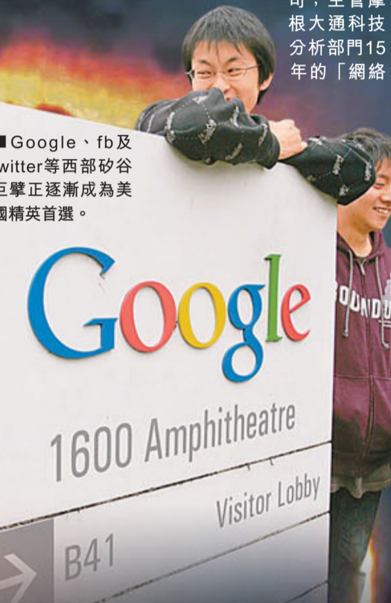
Google、fb及twitter等西部矽谷巨擘正逐漸成為美國精英首選。