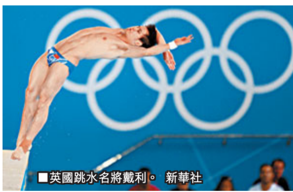
英國跳水名將戴利。

此前，戴利曾準備帶着奧斯卡一起在電視上表演一次10米高台跳水，但卻被官方以奧斯卡年齡太小而制止。「他們說做這樣的動作會對奧斯卡的身體造成