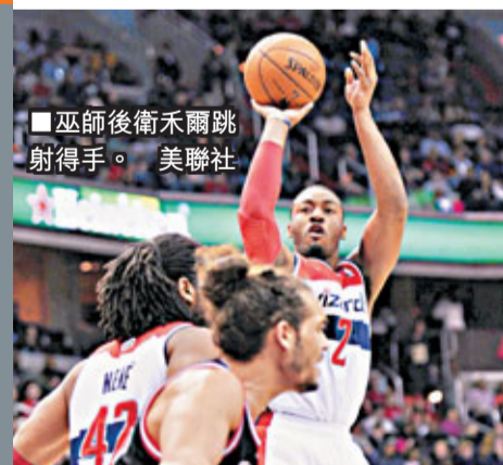
巫師後衛禾爾跳射得手。