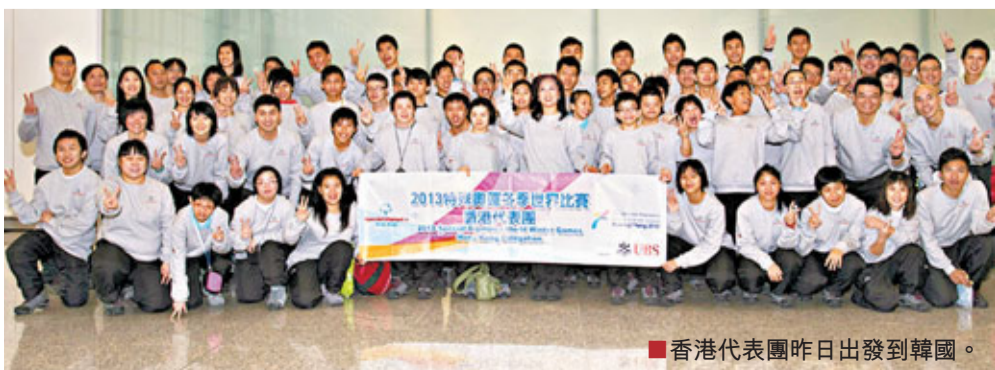
香港代表團昨日出發到韓國。