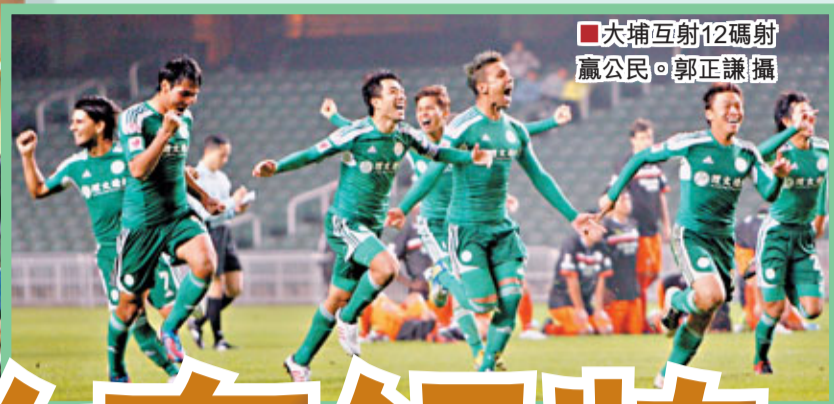
大埔互射12碼射贏公民。