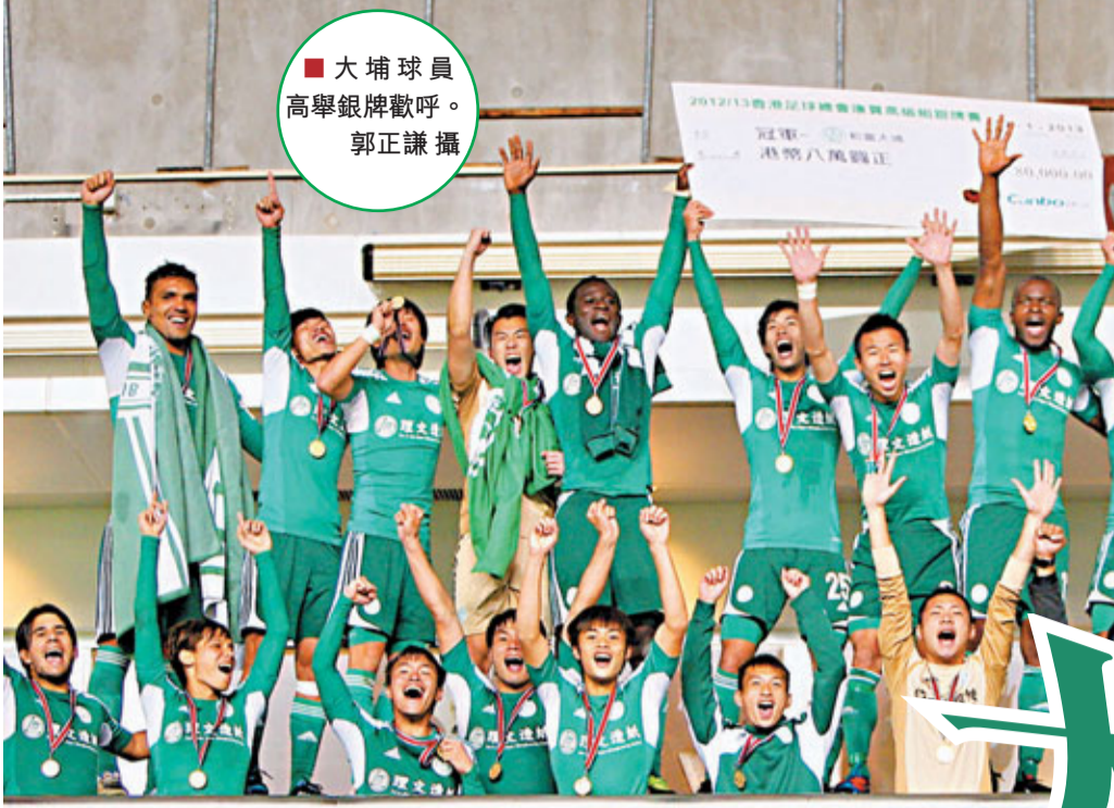
大埔球員高舉銀牌歡呼。

香港文匯報訊(記者 郭正謙)大埔奇蹟逆轉，首奪高級組銀牌冠軍！和富大埔昨日在香港大球場超過3千名球迷面前上演一幕逆轉好戲，一度落後兩球下成功追和2:2，再於互射12碼階段5射皆中，以總比數7:5擊敗公民封王，奪得升上甲組以來第2個錦標。