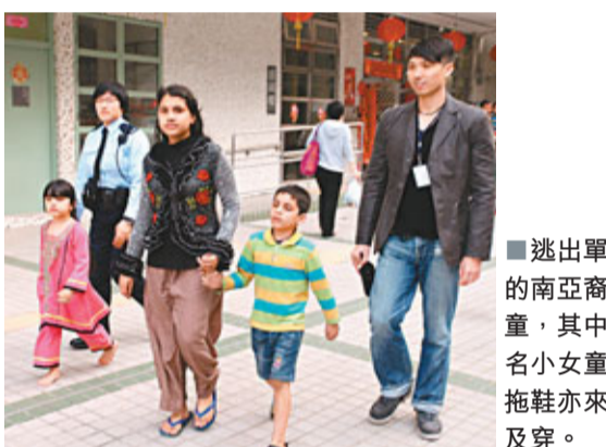
■逃出單位的南亞裔小童，其中一名小女童連拖鞋亦來不及穿。