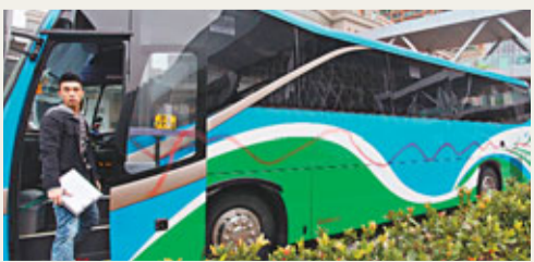
■被刑毀的旅遊巴士車身被噴上長長紅漆。

香港文匯報訊(記者 杜法祖) 一輛停泊在將軍澳景嶺路近香港知專設計學院對開的旅遊巴士，昨清晨6時45分司機折返取車時，赫然發現車身遭人噴上一條長長的紅色油漆。警員接報到場經調查後，暫未知悉疑人噴漆動機，已列作刑毀壞案件處理。