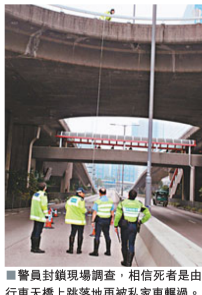
■警員封鎖現場調查，相信死者是由行車天橋上跳落地再被私家車輾過。

警員隨後封鎖現場展開調查，根據目擊者提供資料，相信事主是由行車天橋上自行跳下，再被私家車輾過，相信事件無可疑，惟事主是墮橋致命還是被車輾斃，須待稍後剖驗屍體才能確認。但由於他疑遭私家車輾過，警方將案件列作致命交通意外，交由東九龍總區交通部特別調查隊處理，並設法追查該私家車及司機下落。警方又呼籲任何人士，如目睹該宗意外或有有關資料提供，請致電2305 7500或2305 7606與調查人員聯絡。