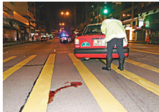
老翁出馬路遭撞飛15呎，現場路面遺有一灘血跡。