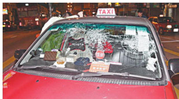
油麻地彌敦道近文明里失事的士擋風玻璃爆裂。

意外後，肇禍的士司機留在現場協助調查，警方經步調查，懷疑有人未有依照行人過路燈指示而胡亂過馬路，但真正肇因仍待跟進調查。