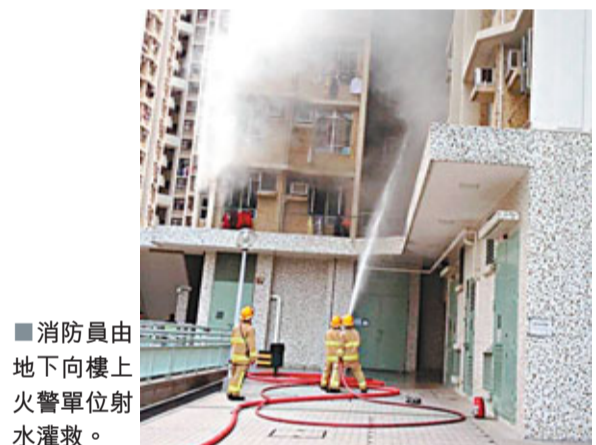
消防員由地下向樓上火警單位射水灌救。

昨日下午4時許，單位其中一房間內存放的雜物突然冒煙着火，火勢迅速蔓延全屋，烈焰和濃煙從窗戶冒出，4弟妹一度被困，幸15歲長姊臨危不亂，自行撲救不果，立即攜同3弟妹一起衝出屋外逃生，匆忙間年紀最幼的妹妹連鞋亦趕不及穿上，4弟弟沿樓梯落樓，到地下管理處求救，其中仔仔因吸入濃煙一度感不適，幸毋須送院。消防員接報到場開喉射水灌救，其間大廈近100名居民聽聞火警鐘大鳴，亦自行疏散到地下街頭暫避，消防員未幾將火撲滅，但單位已嚴重焚毀，幸事件未釀成傷亡。