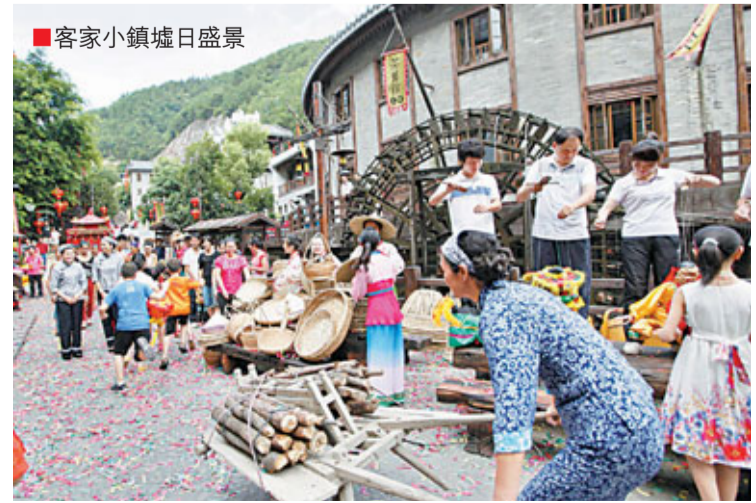
■客家小鎮墟日盛景

之後，每次一想到那個溪聲潺潺的夜晚，想着那個瀟灑着茶香的茶坊，想着那裡的一切一切，心裡就會湧動着再一次去客家小鎮的衝動。如若可以，很想不辭長作小鎮人，在那裡享受着經久不衰的幸福感。