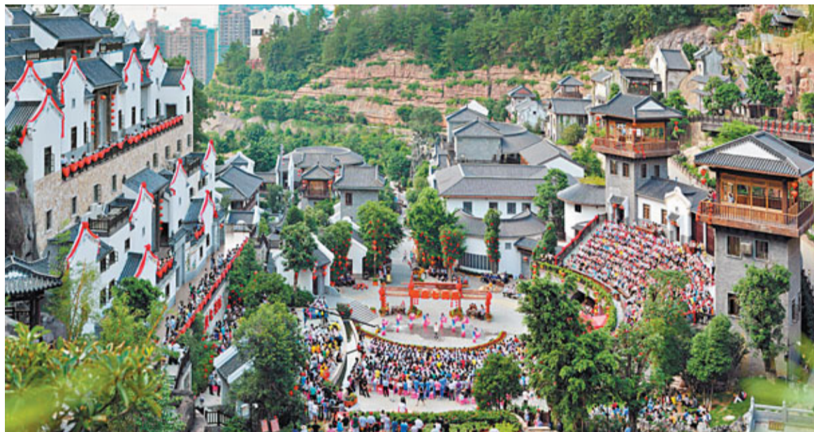
■央視「國慶七天樂」節目2012年9月在國家級4A景區客天下客家記憶廣場錄製

如今六年過去了，汗水沒有白流，理想終於照進了現實，一座已經投資了30億的集旅遊、度假、教育、商業、文化、居住、生態等多層經濟要素相兼容的旅遊