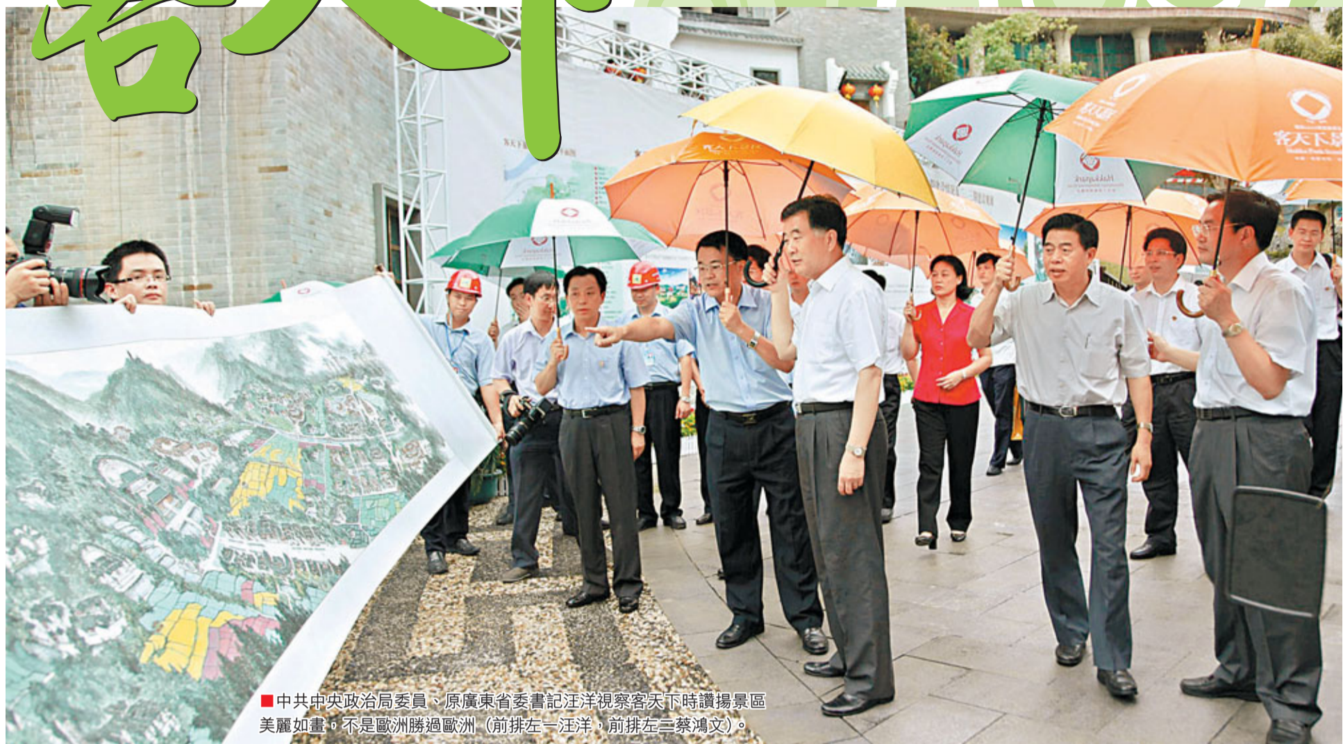
■中共中央政治局委員、原廣東省委書記汪洋視察客天下時讚揚景區美麗如畫，不是歐洲勝過歐洲。(前排左一汪洋，前排左三蔡鴻文)。

展開中華人民共和國廣東省梅州市的版圖，在這座梅艷芬芳的城池一角，鑲嵌着一個美麗的旅遊產業園——客天下。如果說，客家人都有一顆嚮往梅州的心，那麼具有山水、文化與客家大美的客天下，正是天下客家人最好的精神家園。