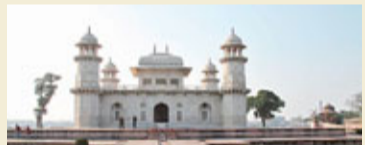
■小泰姬陵 Baby Taj

最後，從小泰姬陵出發去Yamuna河對岸的公園，那裡有原來Shah Jahan想為自己修一個黑色大理石的與泰姬陵隔河對望的陵墓的地方，還有一些地可以看到。進去這個地方要花100盧比的門票，可以看到泰姬陵的落日景色。當然不進去也行，直接走到河邊，景色也不錯。