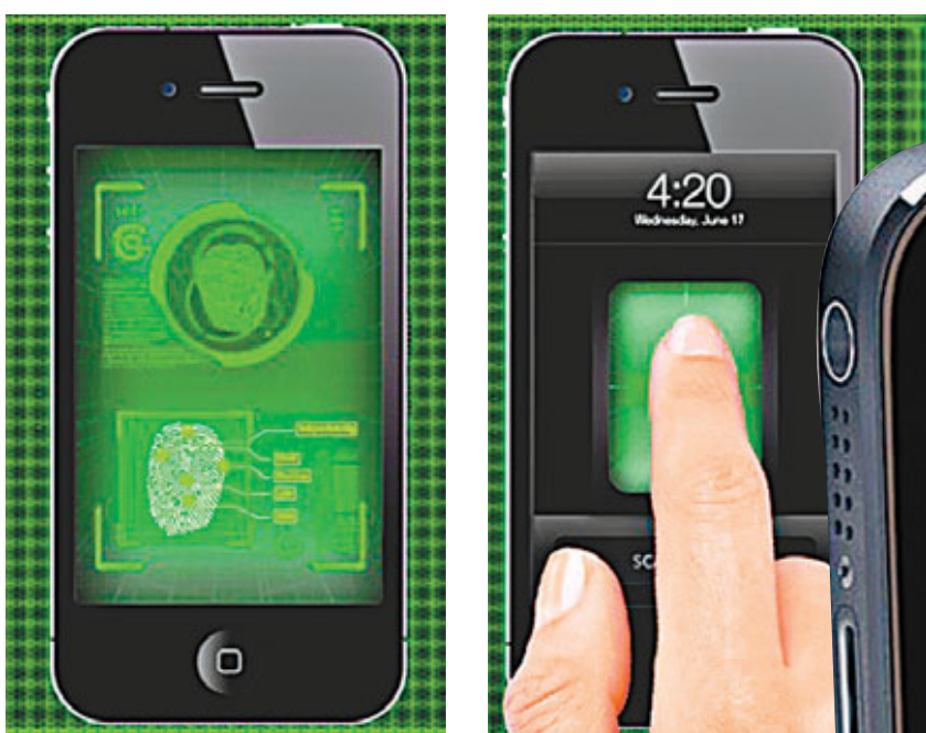
有傳iPhone 6可以利用指紋開鎖。