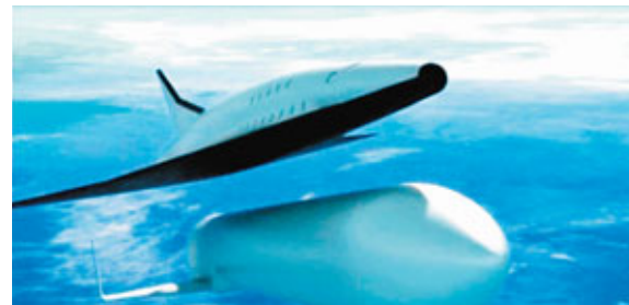
SpaceLiner以火箭推動升空抵達大氣層(右圖)。