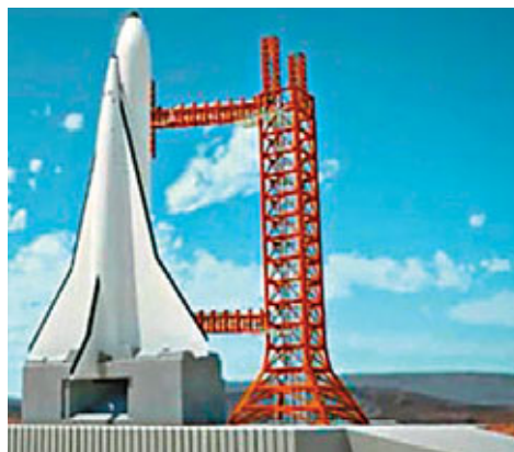
SpaceLiner以火箭推動升空抵達大氣層(右圖)。