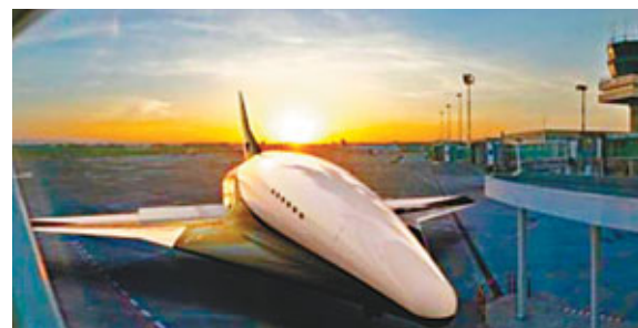
機身採用流線型設計，以超高音速飛行。網上圖片