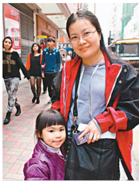
余女士指出，每次公共交通工具加價，都只能無奈接受。

「食可以慳，但搭車要慳也慳不來」，乘客余女士指出，現時每月的交通開支較十年前增加約150元，只能無奈接受，以減少娛樂來補貼。