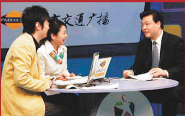
2004年，吉林在《城市零距離》節目與市民交流，開創北京市副市長、市民面對面的先河。