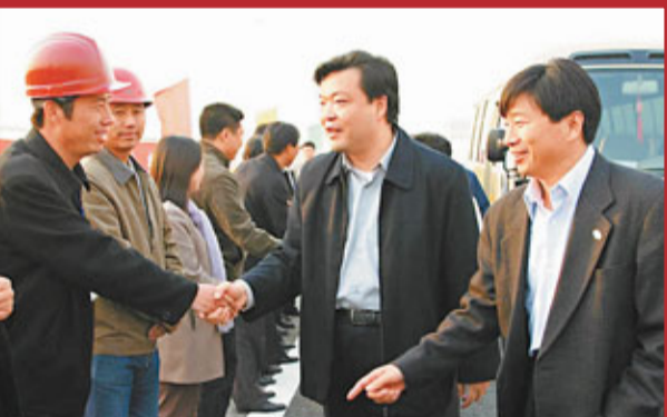
吉林下工地，慰問高速公路建設者。