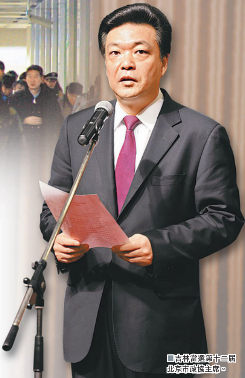
吉林當選第十三屆北京政協主席。

2013年1月25日，北京市政協順利完成換屆，吉林當選新一屆北京市政協主席。2002年就已當選北京市委常委的吉林，如今成為中國首位「60後」省級政協主席。從縣委書記一路走到北京市副市長、常務副市長、北京市委副書記崗位，吉林踏實創新、敢為有為的工作作風，博得各方讚譽。