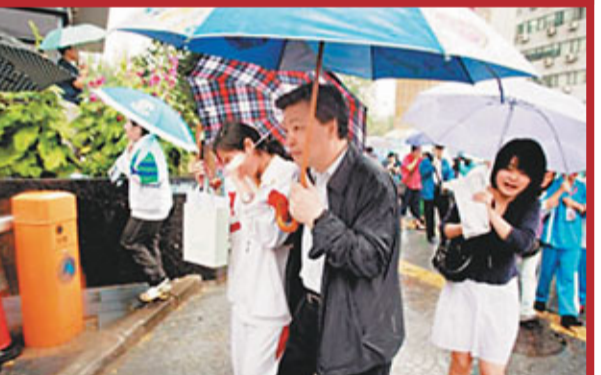
吉林到高考考場校外接女兒。