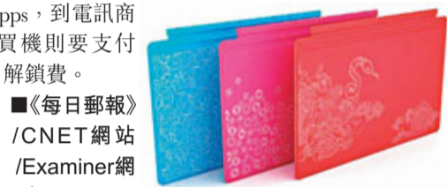
Surface Pro保護套鍵盤另費1,000元。

另外，有傳互聯網搜尋引擎龍頭Google將在5月年度開發會上公布摩托羅拉開發的「X手機」，預料7月正式開售，上台價約299美元(約2,318港元)，零售價則與Nexus手機接近。據報新機不會是Nexus系列，將預載部分apps和遊戲，透過Google Play買機可免費解鎖安裝第三方apps，到電訊商買機則要支付解鎖費。