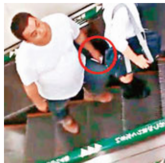
一名男子被拍到在西武池袋線偷拍。