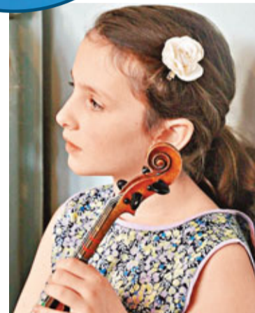
對小提琴愛不釋手。