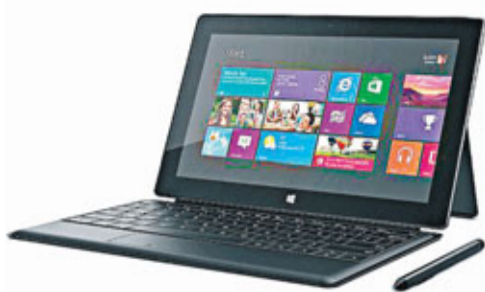
Surface Pro預定下月9日在美加開售。

電腦軟件巨擘微軟宣布推出預載「視窗8」作業系統、可運行Photoshop等常見軟件的平板電腦Surface Pro，預定下月9日於美國及加拿大開售，64GB和128GB版本建議售價分別為899和999美元(約6,970和7,745港元)。「貴」絕全球。