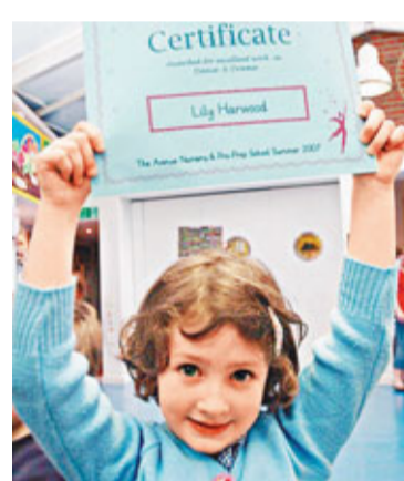
舞蹈和戲劇表演卓越獲頒證書。