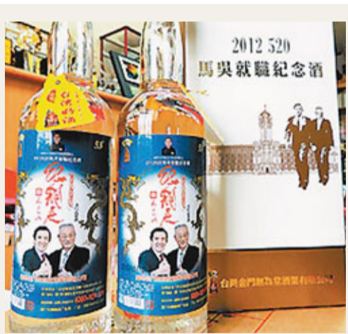
山寨版「馬吳紀念酒」。

2008年，蕭萬長以「副總統」當選人身份，出席博鰲論壇，與當時的大陸國家主席胡錦濤見面，這次見面雙方確立了國民黨重新執政後兩岸關係發展的方向，馬英九形容蕭的博鰲之行是兩岸關係的「破冰之旅」。