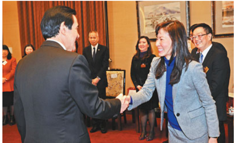
馬英九(前左)昨日在「總統府」接見香港東華三院董事局訪問團，對香港東華三院來訪表示歡迎。

香港文匯報訊 馬英九昨日接見「香港東華三院」壬辰年董事局訪台代表團時表示，自他上任以來，積極推動兩岸和平發展，維持台灣海峽「不統、不獨、不武」的現