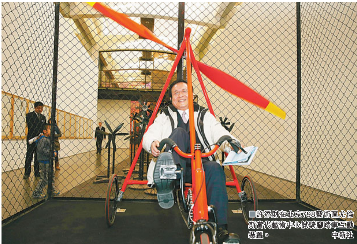
許添財在北京798藝術區尤倫斯當代藝術中心試騎腳踏車。

許添財說，政治人物要順應民意，要讓民意的認知、發展朝着健康的走向前進，不能墨守成規，讓台灣繼續