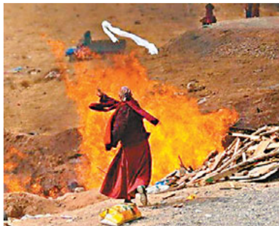
去年中國藏區藏人自焚事件多達76起。網上圖片

香港文匯報訊 據《環球時報》報道，從相關部門了解到，2009年以來，一家名為「哲瓦在線」的網站開始煽動藏區年輕僧人自焚。據藏區有關部門工作人員透露，近年來中國藏區藏人自焚事件不斷蔓延，2012年達到最多的76起。