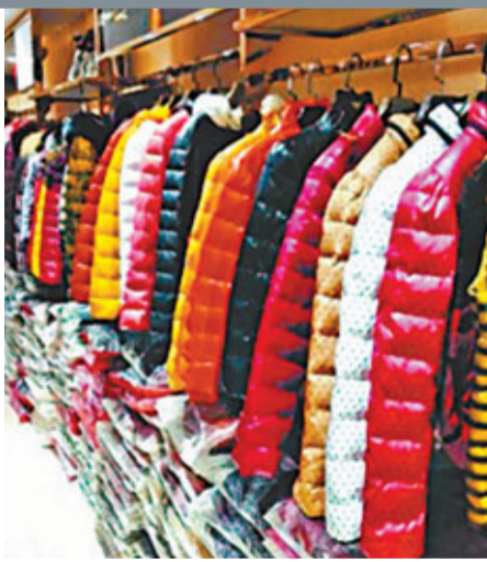
廣東省羽絨服不合格產品發現率高達42.5%。網上圖片

不合格羽絨服裝產品名單包括廣州市銘瑜服飾設計有限公司的女裝羽絨服、廣州依妙實業有限公司的外套、萊姿服飾(深圳)有限公司羽絨服、深圳市粉藍衣櫥服飾有限公司的短羽絨服、廣東聖瑪田服飾有限公司的羽絨服等。