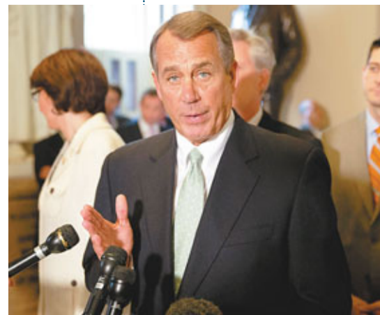
■眾院議長博納向記者交代表決結果。