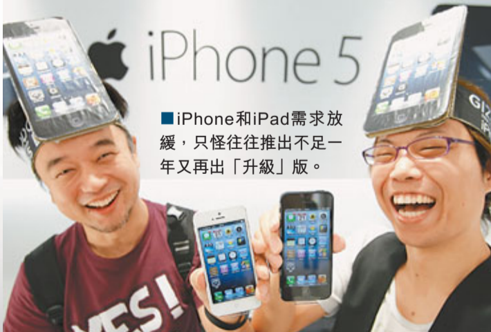
■iPhone和iPad需求放緩，只怪往往推出不足一年又再出「升級」版。