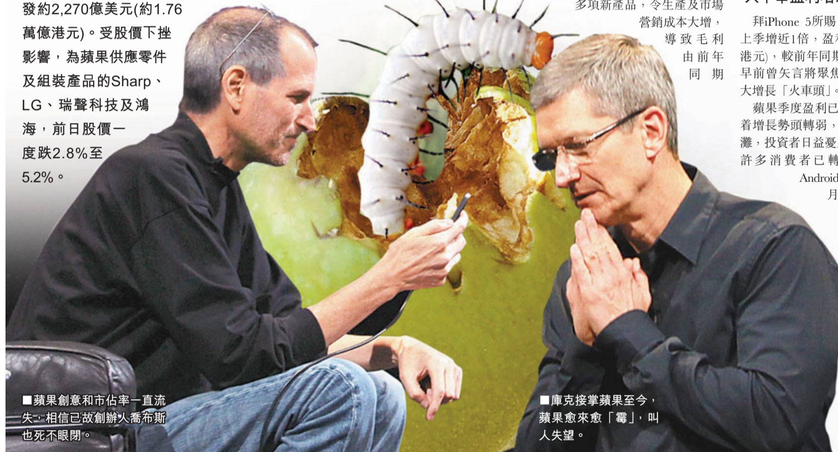
■蘋果創意和市佔率一直流失，相信已故創辦人喬布斯也死不瞑目。