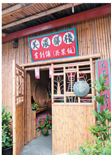
■ 高雄是客家人的據點，這裡有很多客家美食，擂茶就是其中之一。