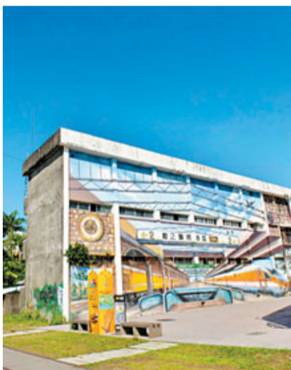
■ 駁二藝術特區過去一年的參觀人次超過二百萬。