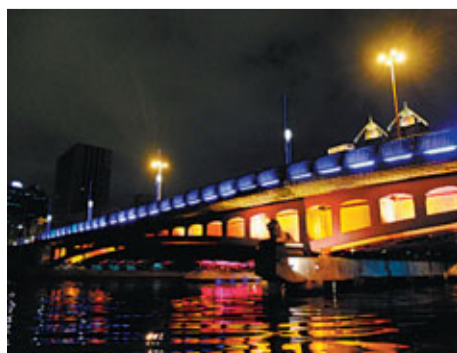
■ 高雄另一個地標——愛河。