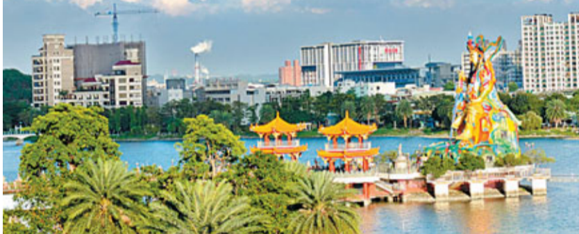
■ 遠眺高雄，可以看見高樓大廈與傳統神像並存的有趣畫面。

如何讓一個城市保有活力？或許在捷運美麗島站可以找到答案。「光之穹頂」——將藝術、設計與建築融合得天衣無縫的公共藝術作品，一走進美麗島車站就可以感受到七彩玻璃藝術的華麗氣質。從沒想過藝術可以如此貼近人們的生活，車站本身就是一件藝術品，國際知名藝術家水仙大師用四年半的時間，在捷運的天花板鑲嵌了集玻璃、手工琉璃與水晶於一身大型圓盤，吸引無數人駐足欣賞。美麗島站被評為世界第二美的地鐵