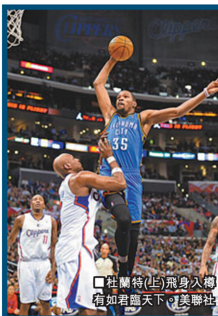
杜蘭特(上)飛身入樽有如君臨天下。

在周二的聯盟巔峰之戰中，雷霆作客以109:97力克快艇，以33勝9負繼續在聯盟一哥寶座上，勝利功臣依然是「孖寶」杜蘭特和韋斯布魯克，二人聯手貢獻58分。 杜蘭特是役貢獻全場最高的32分，韋斯