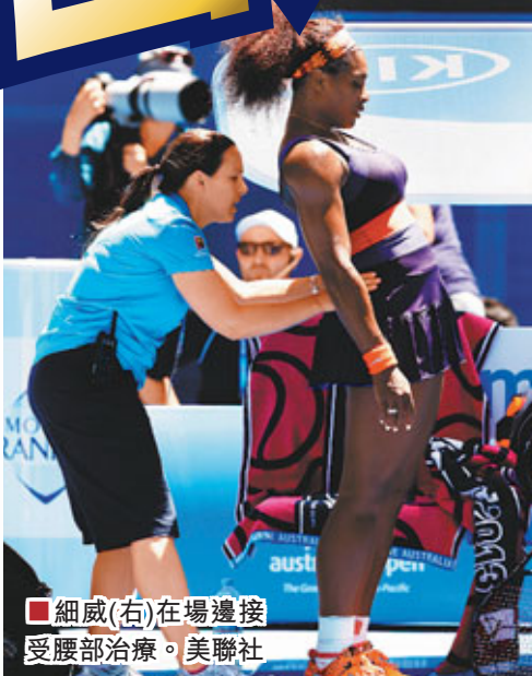
細威(右)在場邊接受腰部治療。