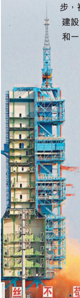
■神十號計劃於今年6月上旬發射，將飛行15天。圖為神九號飛船發射情況。資料圖片