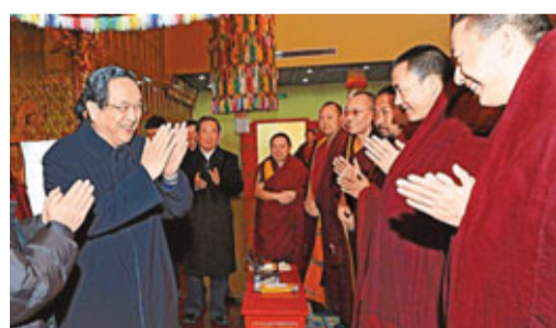
■俞正聲昨日在中國藏語系高級佛學院看望學員。新華社

香港文匯報訊 據新華社報道，中共中央政治局常委俞正聲近日走訪在京的全國性宗教團體時指出，要繼續全面貫徹黨的宗教工作基本方針，發揮宗教界人士和信教群眾在促進經濟社會發展中的積極作用，為實現全面建成小康社會的宏偉目標共同奮鬥。