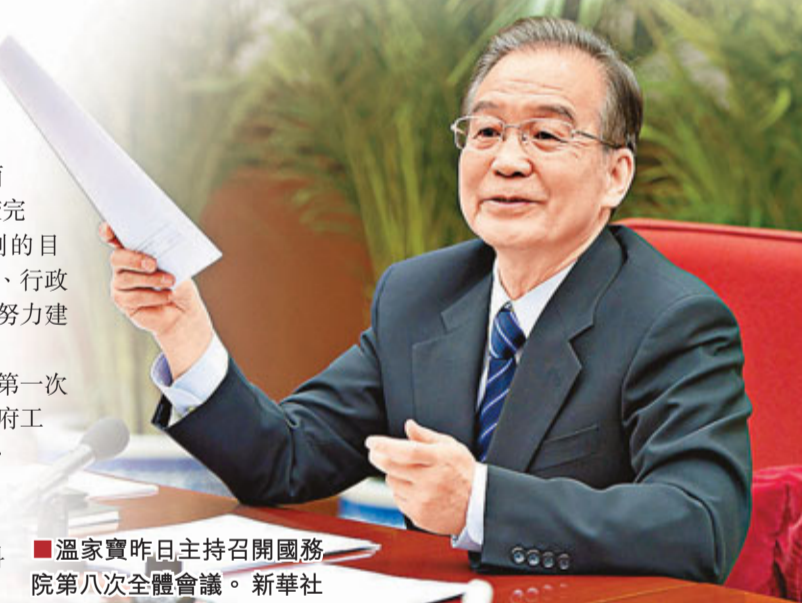
■溫家寶昨日主持召開國務院第八次全體會議。

會議討論了即將提請十二屆全國人大第一次會議審議的政府工作報告，決定將《政府工作報告（徵求意見稿）》發往各省（區、市）和中央有關部門、單位徵求意見。國務院還將召開座談會，聽取民主黨派、專家學者、企業負責人、教科文衛體界人士和基層民眾代表的意見。