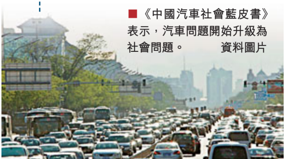
■《中國汽車社會藍皮書》表示，汽車問題開始升級為社會問題。資料圖片

針對公車問題的嚴重程度調查發現，67.5%的居民認為公車超標現象嚴重，77.7%的居民認為居住的城市存在嚴重的公車私用現象，38.5%的城市居民認為交通管制為貴車隊讓行的行為多，在北京表現得尤其明顯。