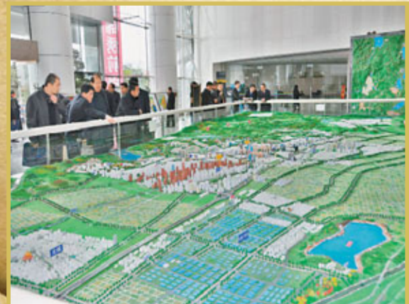
參加招商引資大會的企業代表在玉溪市區沙盤前諮詢

玉溪招商引資、引智與培育如何結合、規劃；玉溪如何融入滇中經濟圈；如何推進3個發展。沒有事先擬出的問題，沒有現成的發言稿，沒有答案，有的只是思考，有的是智者的對話。要實現科學發展，重在產業規劃，符合綠色發展的新型產業才是玉溪的必由之路。無污染和二產中的IT產業，民用航空機械落戶玉溪，是彌補產業空白的新生事物。三湖是玉溪的寶貴資源，同時也是最敏感、脆弱的資源。三產的發展，包括旅遊業的發展要適度，應充分考慮湖泊的環境容量，以後要通過人大的法規定下來……剛剛到任的市委書記張祖林，顯然已摸透了玉溪的家底。記者拋出的問題事前做了功課，市委書記看似脫口而出的對話，實則是對玉溪了然於心的理性規劃。