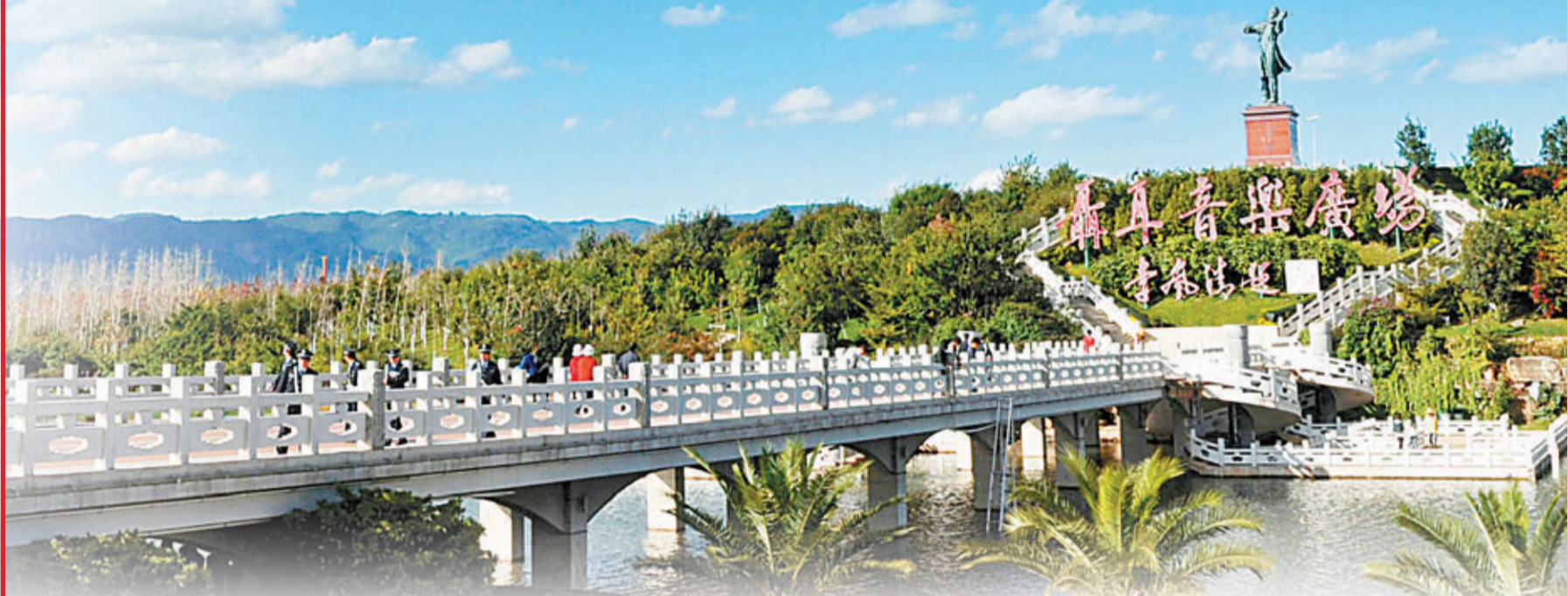
美麗的滇中城市玉溪