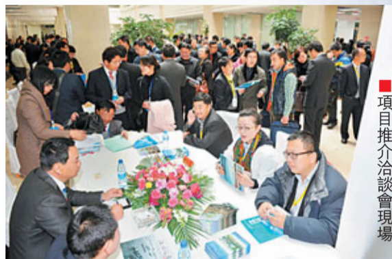
項目推介洽談會現場