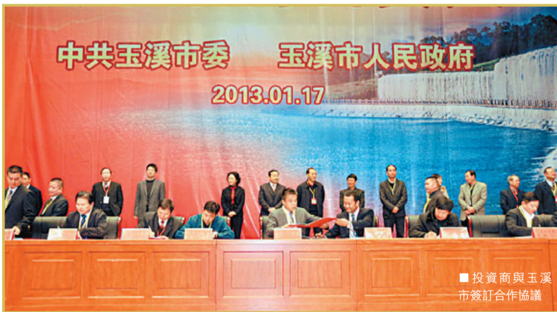
投資商與玉溪市簽訂合作協議

玉溪此次推出的6大板塊招商項目，涉及基礎設施、園區建設、商貿物流、工業生產、農業及生物資源開發、旅遊文化及房地產開發，僅基礎設施建