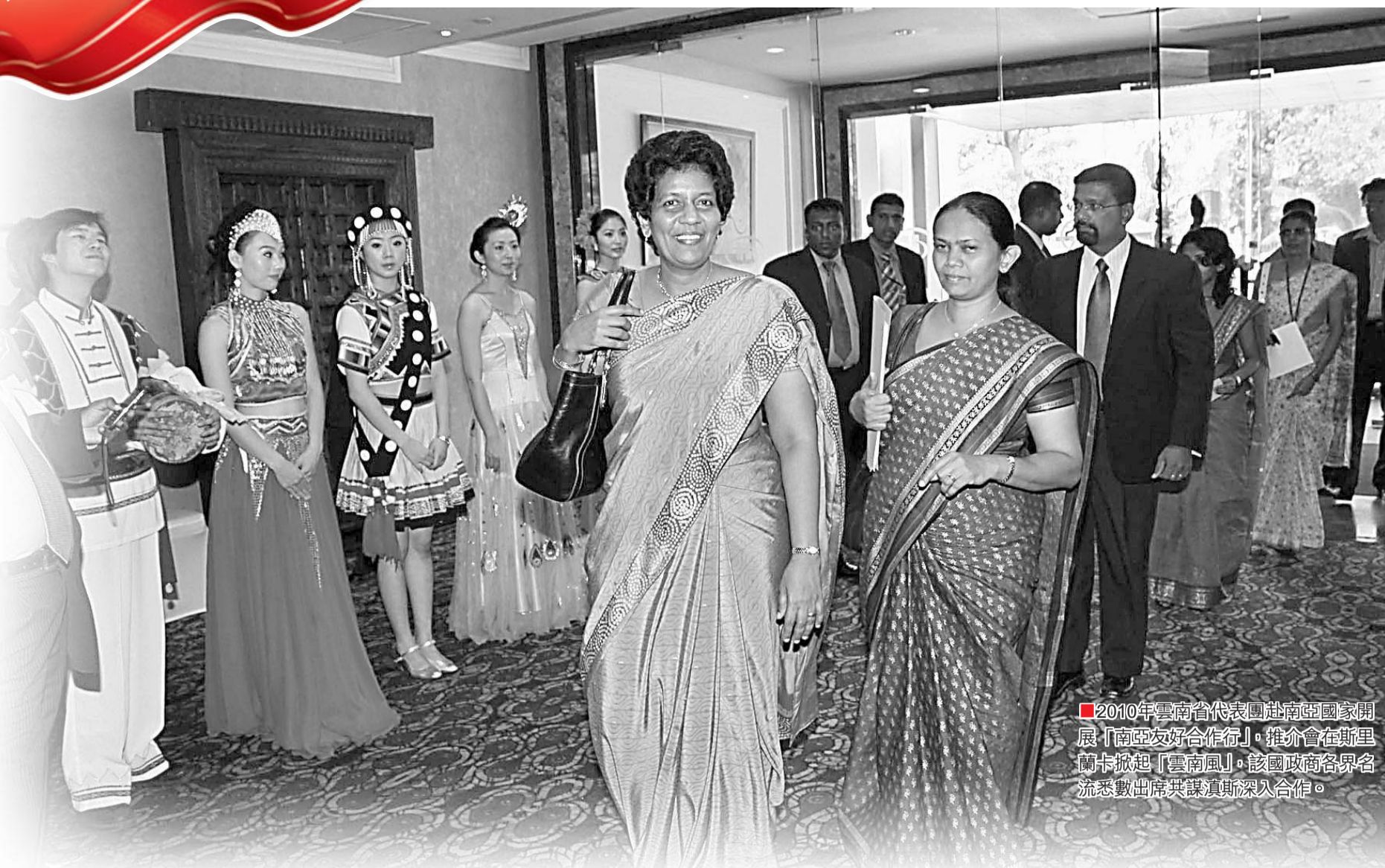
■2010年雲南省代表團赴南亞國家開展「南亞友好合作年」推銷會在斯里蘭卡掀起「雲南風」，該國政商各界名流悉數出席共謀真誠深入合作。