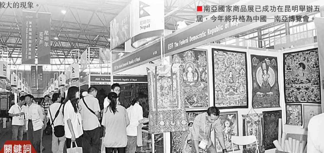
■南亞國家商品展已成功在昆明舉辦五屆，今年將升格為中國—南亞博覽會。