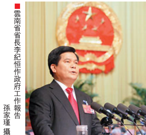
雲南省省長李紀恒作政府工作報告