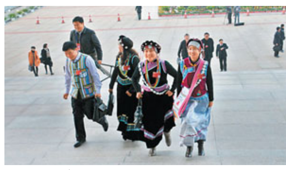
■代表步入會場