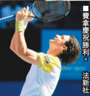
費拿慶祝勝利。

另外值得一提的是，首次參加澳網女雙比賽的中國「小花」鄭賽賽與搭檔普利普琴科一起以2：1擊敗7號種子鄭潔/比韋斯，職業生涯首次晉級澳網女雙4強。 香港文匯報記者 梁啟剛