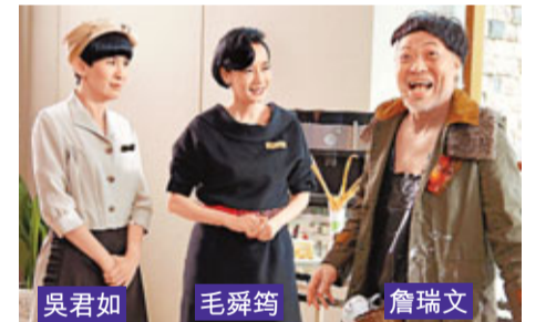
吳君如、毛舜筠、詹瑞文。