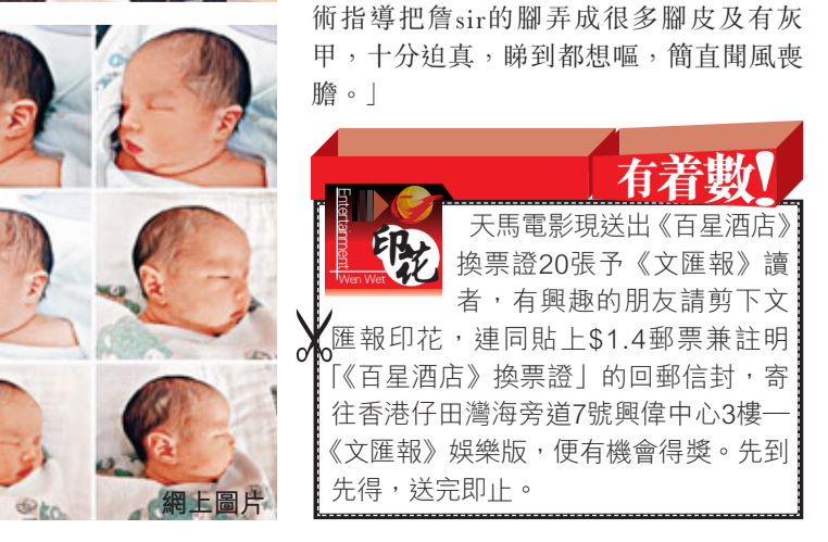
黃奕美國誕女BB首曝光。

香港文匯報訊 日前內地女星黃奕渺小的新生命，那麼我會告訴你總有一個人，會讓你時刻本能的去緊張他；總有那麼一個人，讓你願意甚至付出生命得去保護他；總有那麼一個人，會讓你毫不畏懼地面對偉大；也總有一個人，他如此討人喜歡萬眾期待，感謝上天送來如此寶貴的生日禮物！愛是如此神奇，因為有你。」網友們也紛紛送上祝福，並大讚黃奕女兒下巴尖尖，像媽媽，以後上鏡一定會很漂亮。