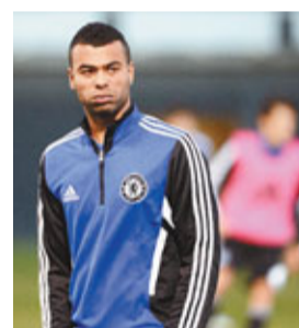
A高已同意續約。

林柏特不獲車路士續約，另一後防老將艾殊利高爾(A高)則已跟藍軍談妥續約1年的條件，這位英格蘭左閘的周薪將上調至20萬英鎊，成為全球最高薪後衛。