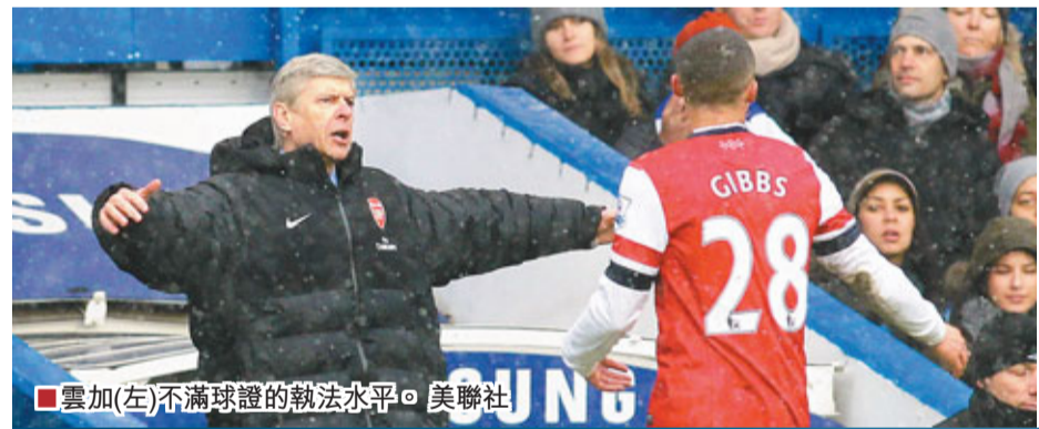
雲加(左)不滿球證的執法水平。