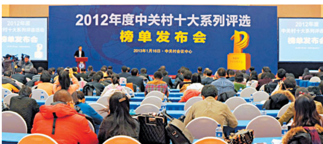
■2012年度中關村十大系列評選揭曉

「2012中關村十大年度人物」包括：雷軍(小米科技董事長兼CEO)、張亞勤(微軟公司全球資深副總裁、微軟亞研發集團主席)、李開復(創新工場董事長兼首席執行官)、楊元慶(聯想集團CEO兼董事長)、玉紅(趣游(北京)科技有限公司董事長兼CEO)、童之磊(北京中文在線數字出版股份有限公司董事長兼總裁)、陳淑寧(文思海輝技術有限公司董事長)、林揚(神州數碼(中國)有限公司首席執行官)、孫陶然(拉卡拉支付有限公司董事長兼總裁)、李衛國(北京高能時代環境技術股份有限公司董事長)。