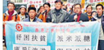
香港工聯會遊行促財爺紓困扶貧。