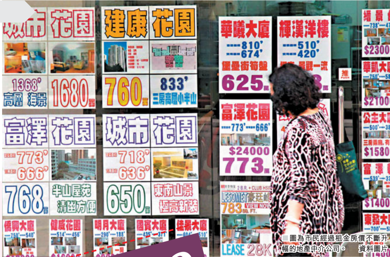
圖為市民經過租金房價不斷升幅的房地產中介公司。

從財政支出角度來看，綜援屬政府一項不輕的財政承擔，據2011年社署年報數字，綜援支出的金額近185億元，佔社會福利的總開支近五成，而社會福利開支則佔該年政府經常開支的第二位，16.8%，僅次於教育項目的22.9%。由此可見，單於綜援一項，對於當局經常開支的承擔着實非輕；但是，近年來綜援卻受到多方批評：一方面，商界和中產納稅人埋怨，綜援制度經常被濫用，供養懶人（身心健全卻長期失業人士）；另一方面，社工界和基層組織指由於綜援