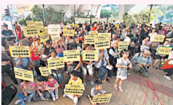
基層組織與特首梁振英對話，表達居住、扶貧、安老、教育等方面期望。

第二大申領綜援類別是身體殘障或健康欠佳人士，其比率近10年是在緩慢、持續地上升，到2011年創15.4%的新高，但其比率卻遠低於首位的年老類別；再就是單親，在這10年該類別的變化不大；之後是失業和低收入人士，這兩個類別有一個共同特性，就是申領數字與經濟周期的波動有着較密切的關係；如2003年至2005年本港的經濟表現較差，這兩個類別都錄得較高的比率。另外，綜援個案總數於2005年創新高後，從接近30萬漸降到2011年稍高於28萬，這也反映，經濟狀況與申領綜援的數字是密切相關。