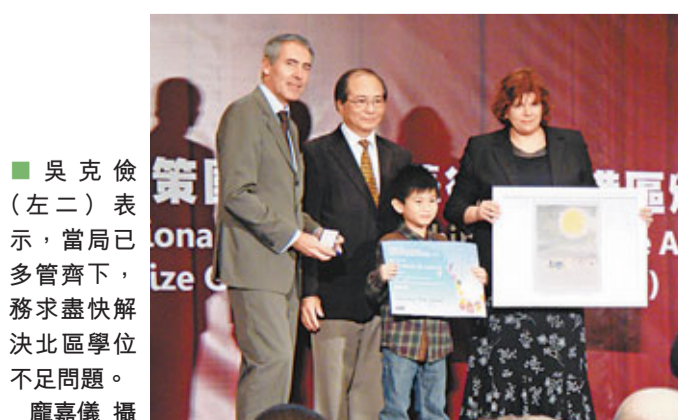
■吳克儉(左二)表示,當局已多管齊下,務求盡快解決北區學位不足問題。

香港文匯報訊(記者 龐嘉儀)小一統一派位申請昨日截止,針對北區等出現學額「爭崩頭」的情況。教育局局長吳克儉表示,當局會有一系列措施應對,包括借調其他區域的學額、每班多派學生、善用空置課室容納更多學生,其中教育局現正與北區4間學校商量,以增加班數,希望在9月開學前解決問題。另外,當局亦會與保安局研究優化口岸過關安排等,以將跨境童導到元朗、屯門等區。