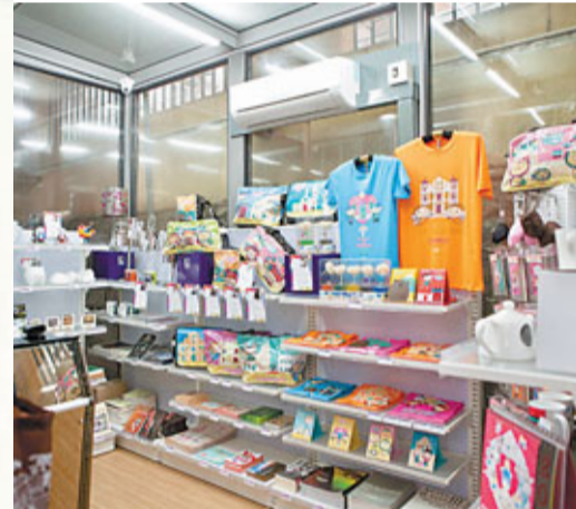
■文化創意商品在店內展示出售

2003年SARS期間，黃錫鈞與陳偉輝連同幾位澳門本土藝術家決定推廣創意產業，但此時的他們，並不完全清楚「創意產業」到底是什麼，只是覺得這或許是一個對澳門發展有益的項目，於是在望德堂區的街頭舉辦一些活動，不斷地在「創意產業」之路上摸索前進。