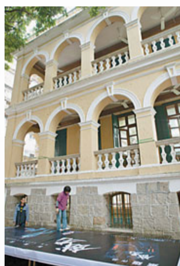
■「瘋堂十號創意園」常邀請藝術家舉辦各種展覽

在累積經驗的過程中，「瘋堂十號創意園」的創意產業之路愈做愈寬，支持和信任的人也愈來愈多，不只得到社會的認同，還得到了政府部門的認同。