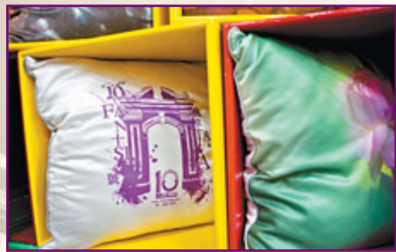
■「瘋堂十號創意園」將文化創意與產業完美結合。