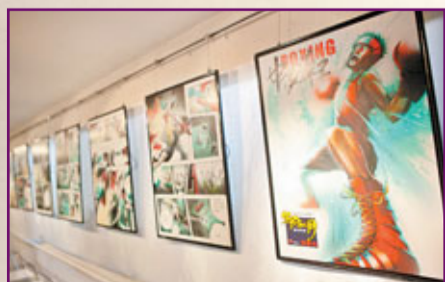
■澳門漫畫家胡智杰的《中國拳王》以兩屆奧運拳擊金牌得主鄧市明為原型。