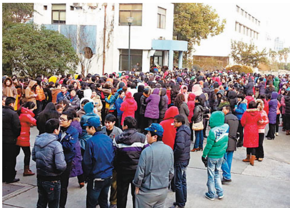
上海神明電機千名員工18日抗議廠方的「霸王條款」，將包含10名日籍高層在內的18名廠方管理人員「軟禁」於廠房。

最新消息稱，神明電機將於今、明兩日停工，由工會、勞動部門介入協調勞資糾紛。今日下午，政府、資方和員工將共同參加一個溝通、協調會議，並要求公司管理層認真考慮員工的合理訴求；同時引導員工依法、理性維權。昨日記者分別致電上海市新聞辦、上海市公安局、上海市人力資源社會保障局相關發言人，但上述機構均未對「軟禁」事件發表任何評論。上海政府官方微博「上海發佈」、上海市公安局官方微博「警直通車」等，亦未提及此事。而神明電機資方，同樣未就此事公開發言。