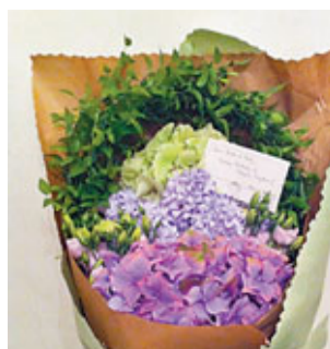
■「伊甸園」(非洲紫羅蘭色系)