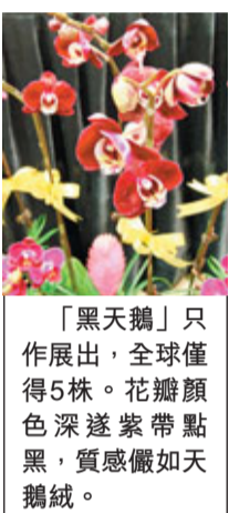
「黑天鵝」只作展出，全球僅得5株。花瓣顏色深紫帶點黑，質感儼如天鵝絨。

而灣仔皇后大道東The East亦浪漫呈獻首個中西合璧的春節暨法式情人節，合和中心露天廣場設置了一道「法式戀人心鎖橋」，配上粉紅櫻花，更仿效巴黎塞納河的情人橋，讓一雙雙愛侶到橋上，扣上寫有兩人名字的連心鎖，祝願愛情天荒地老，永不分離。