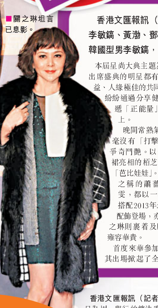
關之琳坦言已息影。

香港文匯報訊(記者 章蘿蘭 常熱報道) 走過12年的「星尚大典」昨晚在江蘇常熟揭幕，張栢芝、關之琳、李敏鎬、黃渤、鄧萃雯、吳宗憲、蕭薈及秦嵐等一眾明星亮相，令紅地毯星光燦爛。首次坐鎮「星尚大典」的韓國型男李敏鎬，大受現場女粉絲歡迎，更自爆從小就看關之琳的電影，並大讚她是非常偉大的女明星。