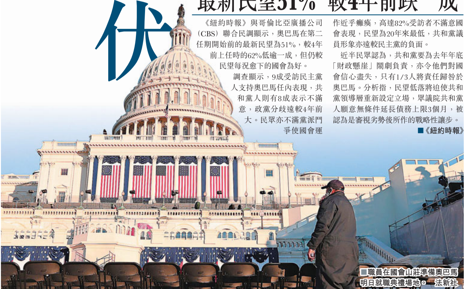
職員在國會山莊準備奧巴馬明日就職典禮場地。