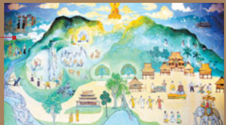
■劫外是孟連娜允傣族土司的避暑山莊。圖為其壁畫。

上、路旁、河邊，不種菜也會有菜吃。傣族也因此將這裡視為上天賜給他們的富地，所以遷徙於此「好地方」。