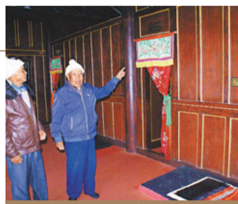
■門口的臥榻即是土司睡覺的地方。

的傣族官家(竹)樓樣式，建築為三層房屋形式，高大寬敞，呈方形，屋頂呈殿式三角錐狀，不同的地方在於用瓦片替代了木片覆蓋，木柱建在石墩上，屋內橫樑穿柱，結構簡單。二樓三面有迴廊，廊的盡端有寬敞的平台謂之「展」，是室內空間向戶外空間的延伸，是觀景的好地方。舒展的屋頂是傣家竹樓尤其引人注目的地方，既利於排水，又利於遮陽，一色的青磚灰瓦，一色的吊角飛簷，古樸，輕靈。