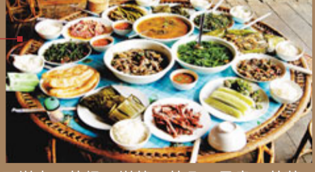
■樹皮、草根、樹葉、花朵、昆蟲、苔蘚，孟連人沒有甚麼不敢吃。