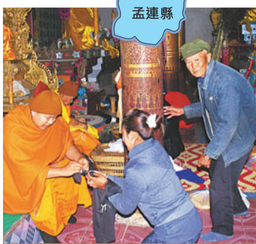
■談佛是孟連傣族人家生活中不可或缺的部分。

在娜允這個中國最後的傣族古鎮，縱使土司制度已結束六十多年，這裡始終是新老世代的心靈家園。