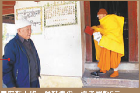
■穿鞋上路，脫鞋禮佛。違者罰款5元。