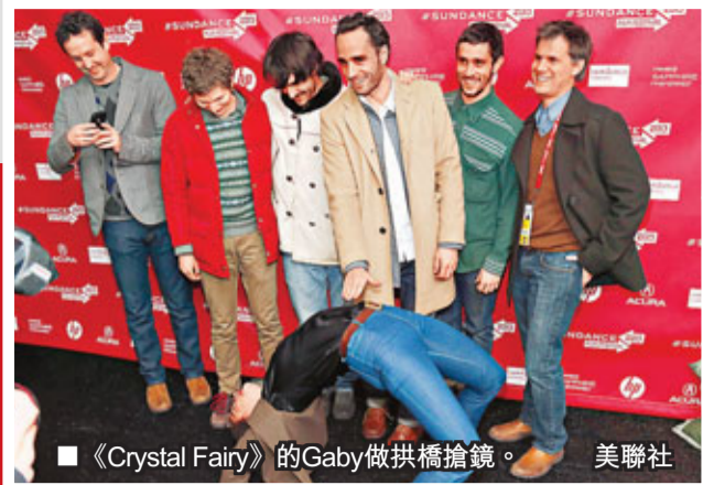
《Crystal Fairy》的Gaby做拱橋搶鏡。