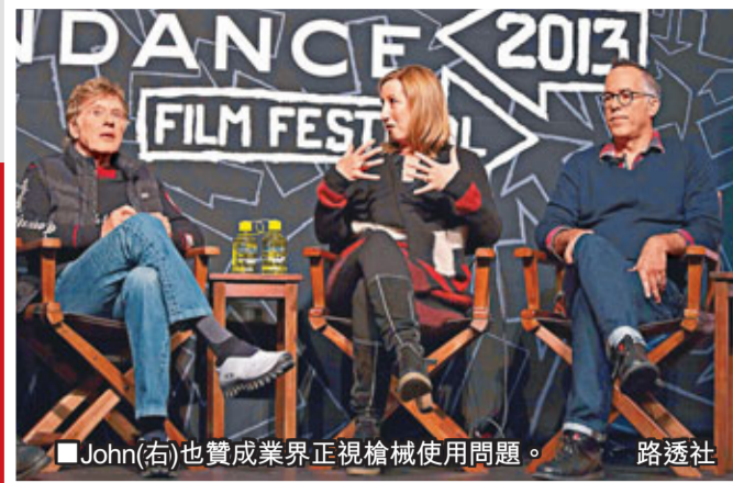
John(右)也贊成業界正視槍械使用問題。