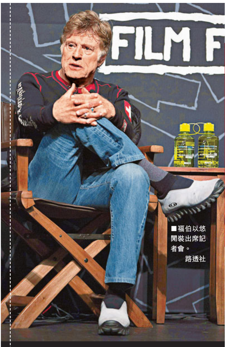
福伯以悠閒裝出席記者會。