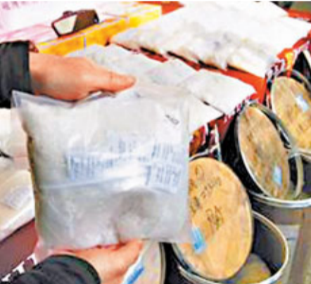
被查扣的各類毒品達230多公斤。圖為有關人員展示起出貨品。

警方稱,在倉儲人員充當內應下,竹聯幫東堂的毒品走私幾乎無往不利。該集團主要採用「強渡關山」與「偷天換日」兩種手法,前者是將毒品夾藏在香菇、衣飾等貨櫃中,由香港空運到桃園機場,在抵達桃園機場之前,倉儲人員趁檢驗之前夜偷偷取走毒品。 而所謂「偷天換日」,就是將毒品藏在A貨櫃中報進口,再將B貨櫃報出口,趁機偷換兩個貨櫃標示後,再將B貨櫃辦退貨,讓夾藏毒品的A貨櫃得以魚目混珠,