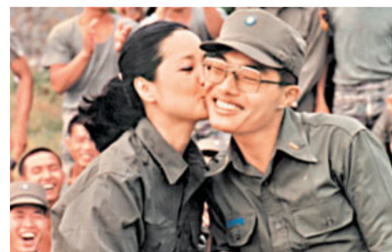
這位幸運兒(右)今年應該50多歲了。資料圖片

據中社18日電 一代歌后鄧麗君逝世已18周年,鄧麗君文教基金會和台灣《聯合報》將於本月底在台北舉辦展覽會,展出一批鄧麗君生前的寶貴照片,當中包括一張1981年在金門烈嶼勞軍的照片,一位當年在烈嶼服役的少尉軍官有幸得到鄧麗君的親吻,主辦單位目前正「全力通緝」這名幸運兒,盼他可現身25日展覽開幕禮,與一眾歌迷一起分享當年與鄧麗君的點點滴滴。