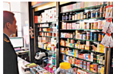
港貨店內貨架上擺滿了藥品。

據採集,聯合執法組最終取締了這家以港貨店為幌子的非法售藥點。近日,該案正式移交龍崗公安局,成為龍崗區2013年首個移送司法機關追究刑責的涉藥案件。