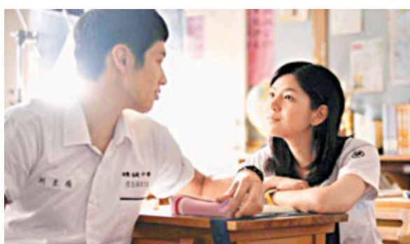
獲「認可證」的台灣電影將不受配額限制。圖為電影《那些年,我們一起追過的女孩》劇照。

根據相關規定,陸台合拍片在大陸發行方面,享受國產影片相關待遇。辦法也指出,台商投資者在大陸投資改建影院,參照外商投資規定執行。