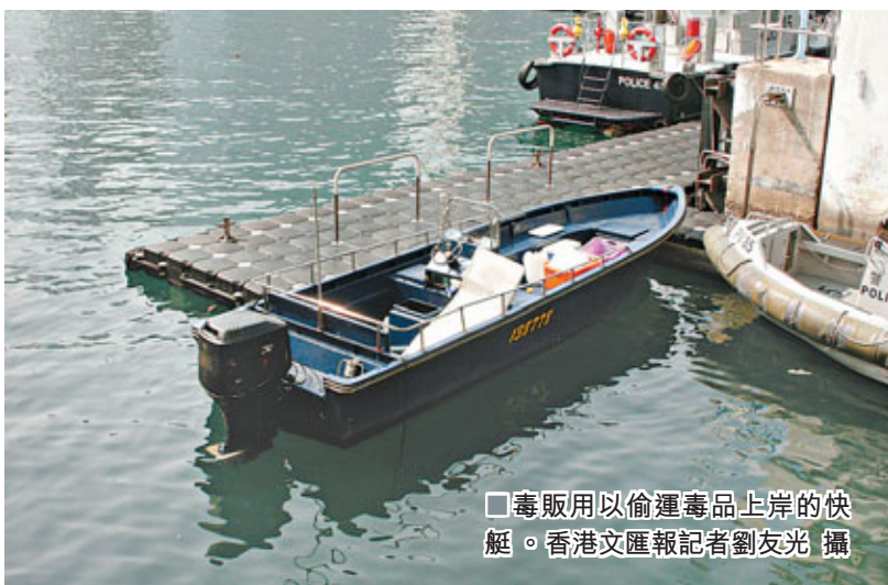
毒販用以偷運毒品上岸的快艇。

香港文匯報訊 (記者 劉友光) 販毒集團謀劃搶佔農曆新年假期娛樂場所的毒品市場而預早「入貨」，為逃避警方堵截，更罕見利用快艇走私毒品闖境。幸警方毒品調查科早接獲情報，昨在香港仔田灣海旁道趁毒販交收時現身，經糾纏終成功拘捕4名男子，截獲運毒快艇及七人車，檢獲8公斤市值逾95.2萬元的K仔，糾纏間3名探員及1名毒販受傷送院。