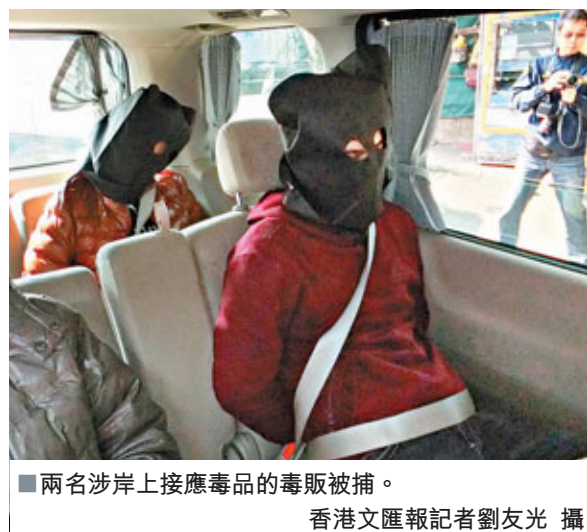
兩名岸上接應毒品的毒販被捕。