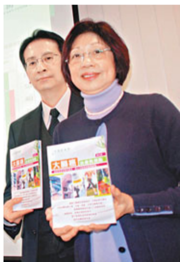
香港防癌會成立「助醫基金」,提供資助或藥物贊助,紓解患者經濟負擔。