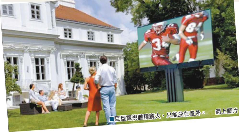
巨型電視體積龐大，只能放在室外。網上圖片