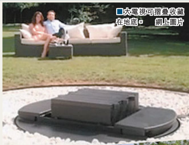
大電視可摺疊收藏在地底。