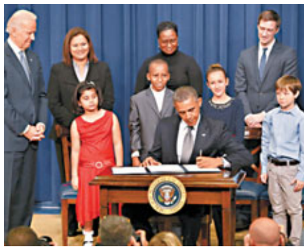
奧巴馬。共和黨籍得州州長佩里表示，槍支有人拉動扳機才能作惡，稱康州犯案的青年是「鬼上身」，控槍無法令肇事的桑迪胡克小學學生倖免於難。眾院議長博納亦指控槍無迫切性。

防長帕內塔回應說：「我不明白那該死的人為何需要武器」，強調軍人需擁槍。最少兩名擁槍派的共和黨議員揚言彈劾