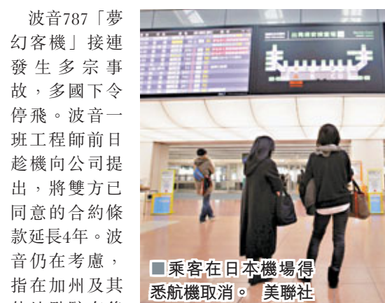
乘客在日本機場得悉航機取消。

波音787「夢幻客機」接連發生多宗事故，多國下令停飛。波音一班工程師前日趁機向公司提出，將雙方已同意的合約條款延長4年。波音仍在考慮，指在加州及其他地點駐有後備人員，能取代工會工程師。專家指出，如果工會此時罷工，會影響對「夢幻客機」的安全檢查。