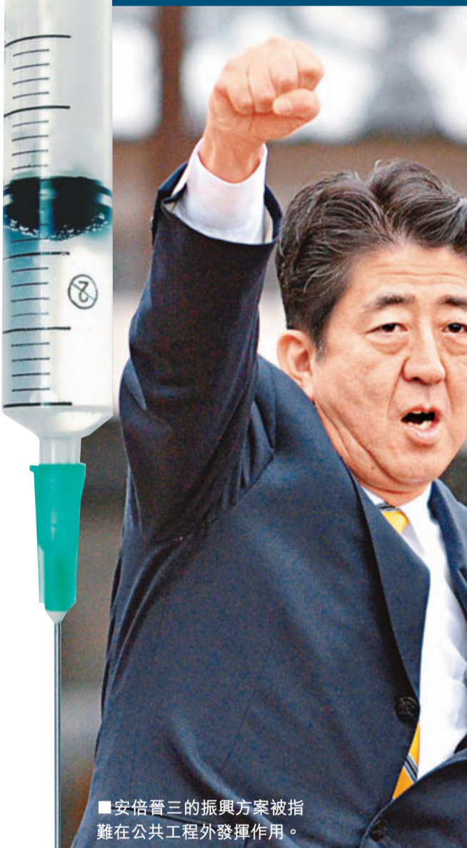
■安倍晉三的振興方案被指難在公共工程外發揮作用。