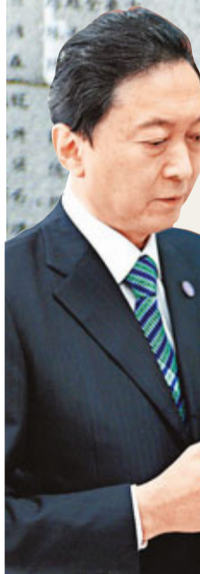
鳩山手握象徵和平的「紫金花女孩」銅像。