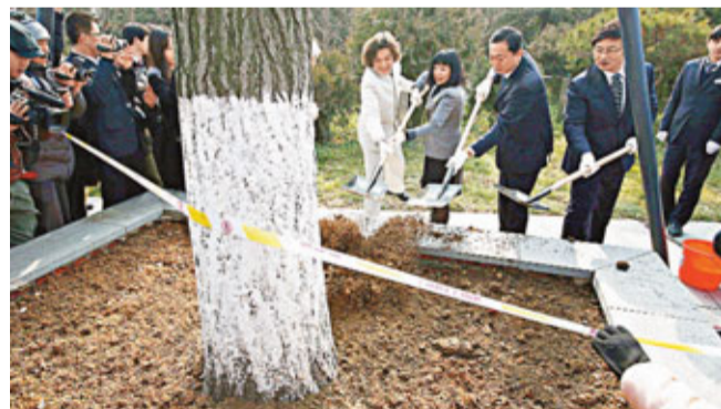
昨日，鳩山由紀夫在中國南京大屠殺遇難同胞紀念館種下了一棵銀杏樹。