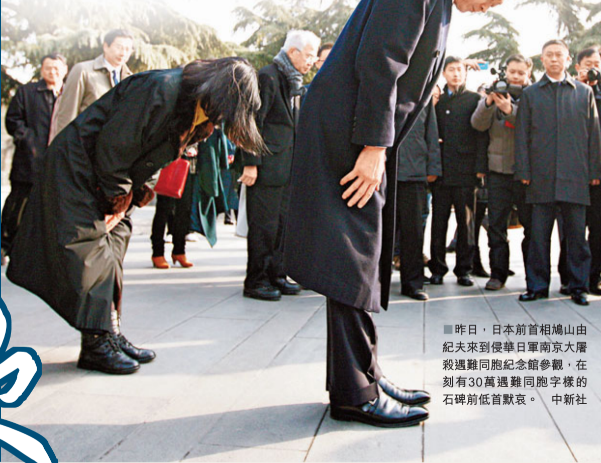
昨日，日本前首相鳩山由紀夫來到侵華日軍南京大屠殺遇難同胞紀念館參觀，在刻有30萬遇難同胞字樣的石碑前低首默哀。

記者觀察到，在參觀期間，鳩山多次雙手合十向遇難者表示默哀。當鳩山看到和平舞台上的牆上寫着「不是為了復仇，而是為了銘記歷史教訓，為了大愛，我們應該延續世界和平。」這句話時，他表示很感動，也會特別銘記這一句話。當鳩山走到手抱嬰兒、放飛和平鴿的和平女神像前，他說，「這雕塑有一隻鴿子，我的名字『鳩山』就是鴿