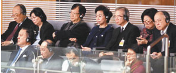
■特首夫人在立法會參與旁聽。