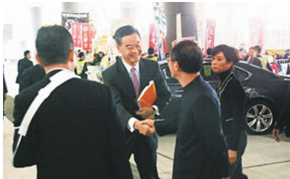
■梁振英抵達立法會外，與曾鈺成握手。