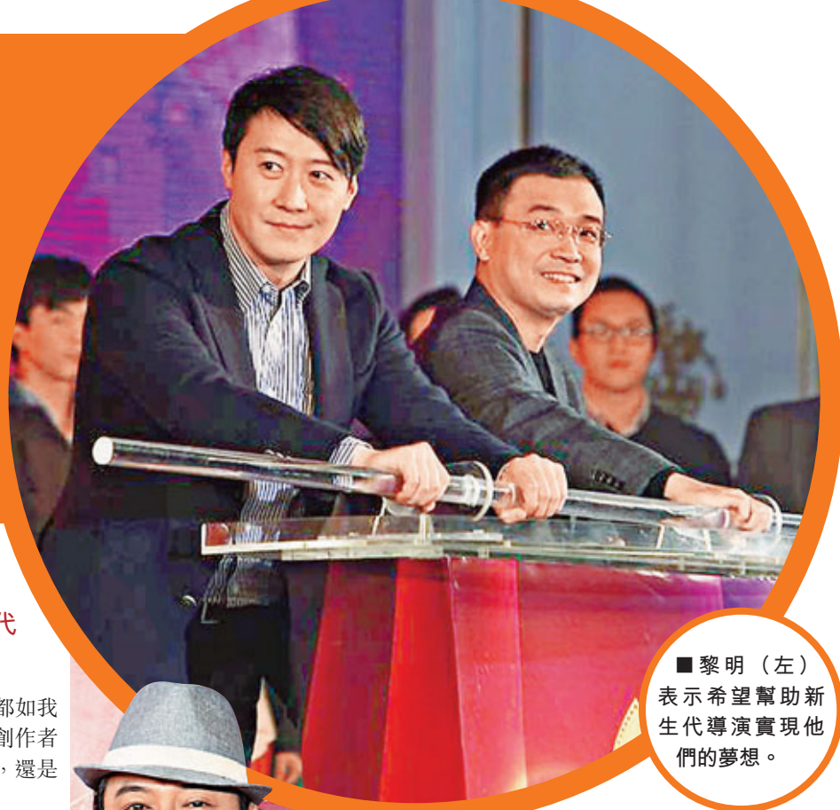
黎明(左)表示希望幫助新生代導演實現他們的夢想。

此前有傳蔡永康將辭別《康熙來了》,借此機會,蔡永康澄清:「我的意思是不會主持到死,我暫時沒有離開《康熙》的打算,雖與小S主持8、9年《康熙來了》,但完全沒有苦撐的感覺,因為每次錄影都很好玩,能有一個這樣的節目是上天的恩賜。小S是最愛的女生。如果要退出節目就沒辦法與小S定期相會,會覺得很可惜。」