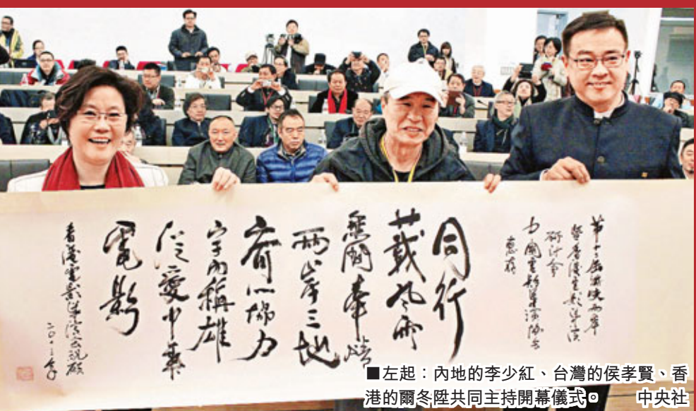
左起:內地的李少紅、台灣的侯孝賢、香港的關冬陞共同主持開幕儀式。