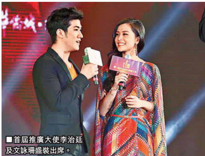
首屆推廣大使李治廷及文詠珊盛裝出席。