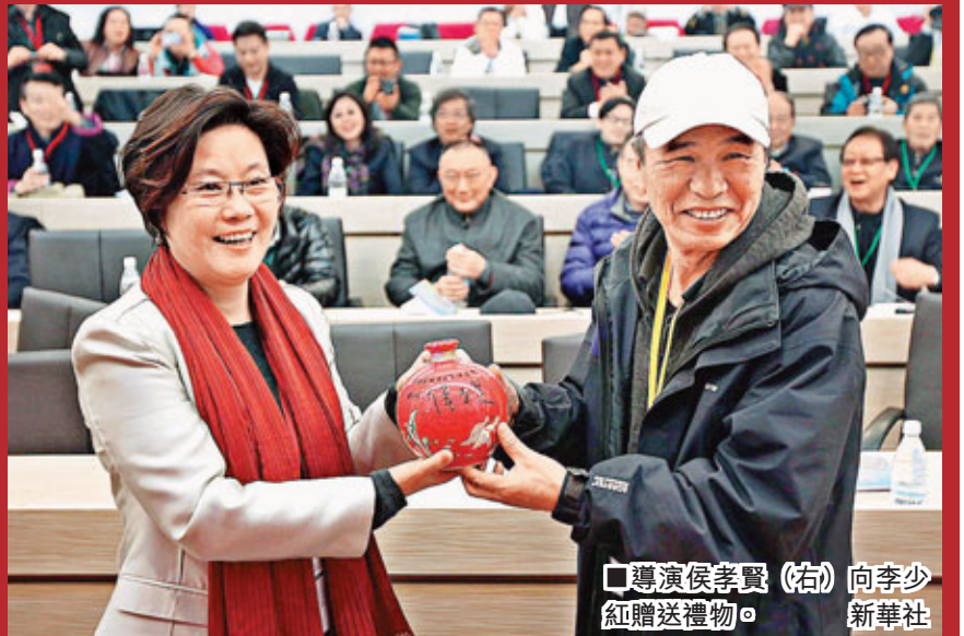
導演侯孝賢(右)向李少紅贈送禮物。