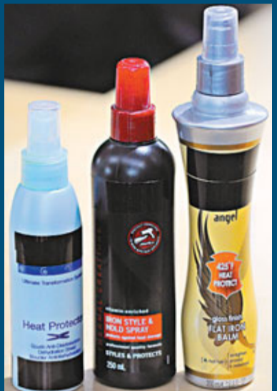
■部分順髮劑或直髮劑含有可釋出甲醛的成分。