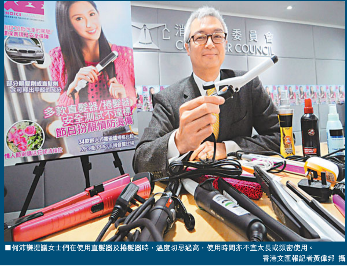
■何沛謙建議女士們在使用直髮器及捲髮器時,溫度切忌過高,使用時間亦不宜太長或頻密使用。