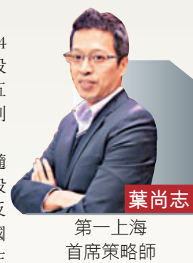
第一上海首席策略師

恒指出現高開高走的行情，盤中最高曾上摸到23,442，但是未能突破近期的最高點23,487。受到內地A股的升勢帶動，中資金融股出現全面彈升，其中，工行(1398)、招行(3968)以及中行(3988)等，股價都能升穿近期高位再創年新高。恒指收盤報23,413，上升149點，主板成交量有775億多元。技術上，恒指仍守在10日均線23,239的上方，回吐走勢未有進一步加劇。而在過去的四個交易日，恒指的每日盤中低點分別是23,142、