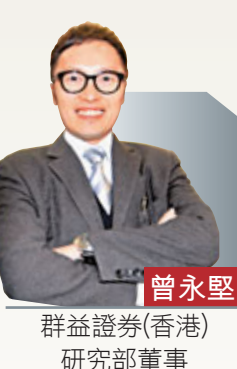
群益證券(香港)研究部董事

從資金流向面、市場對中國經濟今年前景及普遍企業未來十二個月的盈利預期趨向以及主要指數技術面為研判基礎，預計港股未來十二個月內的反覆上勢趨勢未改，但預估短線調整壓力將延續。中國人民銀行於上周五召開的央行2013年工作會議首次提及要積極做好合格境內個人投資者(QDII2)試點相關準備工作，昨天再燃起市場炒作資金南下概念，有助抵銷短線技術回吐壓力的影響，恒生指數短期內將於22,900至23,700區間反覆。