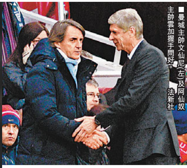
曼城主帥文仙尼(左)及阿仙奴主帥雲加握手問好。

力求衛冕英超冠軍的曼城，於香港時間14日作客以2:0力克阿仙奴，自1975年後第1次在聯賽中客場擊敗「兵工廠」。此役第75分鐘，曼城隊長高柏尼禁區前鏟球擊倒阿仙奴球員，球證向恩紅牌直接罰下，這一判罰激起了曼城主帥文仙尼不滿並表示，曼城將為高柏尼的紅牌向英足總提出申訴。