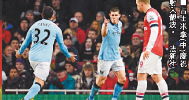
占士米拿中慶祝射入靚波。