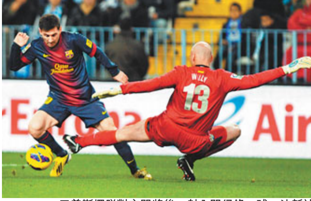
美斯擺脫對方門將後，射入開紀錄一球。