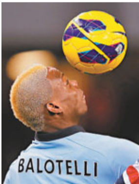
普蘭迪利說，「他必須要去思考如何在場上證明自己的價值，不要去當『超級英雄』或者『個性馬利奧』什麼的。另外，我們教練也必須去找到挖掘他潛質的最好辦法。」目前效力英超曼城的「巴神」一直和主教練文仙尼矛盾不斷。

新華社羅馬13日電 意大利國家隊主帥普蘭迪利13日在接受當地媒體採訪時談到了麻煩不斷的曼城前鋒巴洛迪利(見圖)，奉勸他不要老想着充當「超級英雄」。「巴洛迪利和我們在一起時，在國際比賽中一直發揮不錯。」普蘭迪利說，「他必須要去思考如何在場上證明自己的價值，不要去當『超級英雄』或者『個性馬利奧』什麼的。另外，我們教練也必須去找到挖掘他潛質的最好辦法。」目前效力英超曼城的「巴神」一直和主教練文仙尼矛盾不斷。