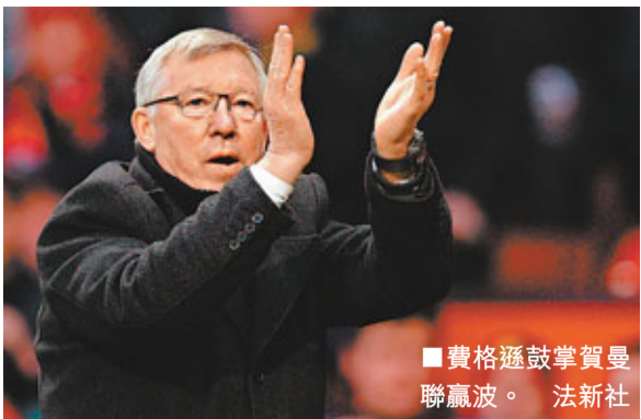
費格遜鼓掌慶祝曼聯贏波。