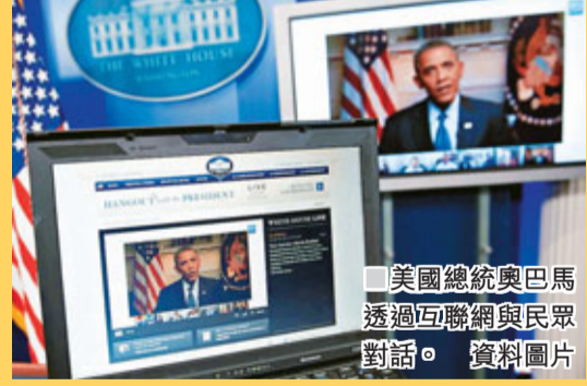
美國總統奧巴馬透過互聯網與民眾對話。資料圖片