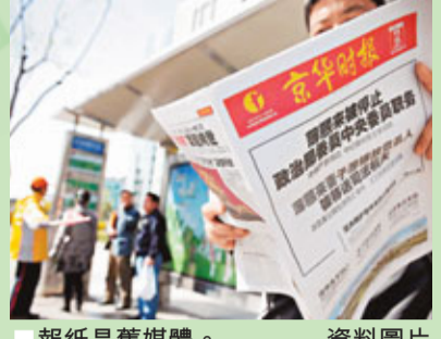
報紙是舊媒體。資料圖片

Twitter及facebook都是新媒體 (New Media)，又稱「第四媒體」。新媒體泛指利用電腦及網絡等新科技來傳播訊息及內容的通訊形式。至於傳統媒體意指報紙、雜誌、電台與電視等。在具體分類上，新媒體可細分為門戶網站、搜索引擎、虛擬社群、電子郵件、即時通訊、博客、網絡遊戲、電子刊物、廣播、網絡電視及手機短訊等。相比之下，新媒體所指的產業範圍不及舊媒體明確。由於舊媒體產業的市場力量仍為主流，大部分政府部門仍以管制舊媒體方式來規範新媒體。