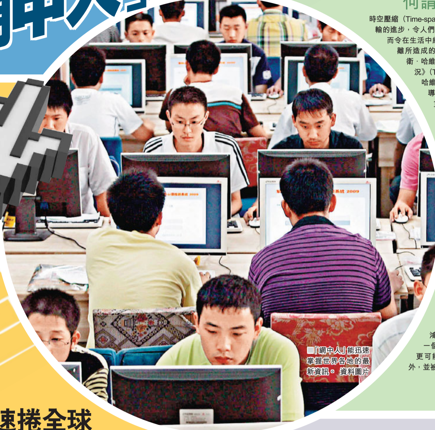
「網中人」能迅速掌握世界各地的最新資訊。