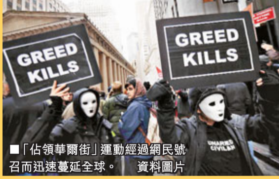
「佔領華爾街」運動經過網民號召而迅速蔓延全球。資料圖片