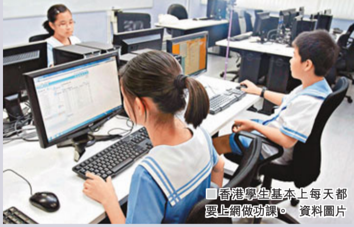
香港學生基本上每天都要上網做功課。資料圖片