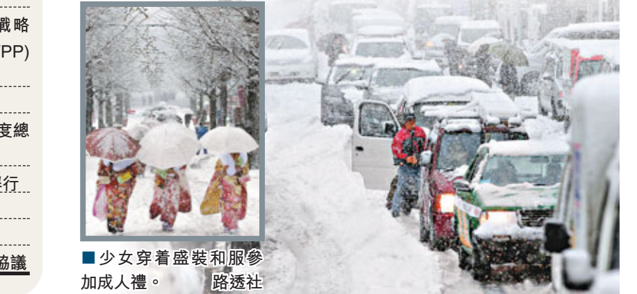
少女穿着盛裝和服參加成人禮。路透社

日本關東及東北廣泛地區昨下起大雪，路面積雪嚴重影響交通。據報一名57歲男子於除雪時死亡，各地亦最少有267人受傷。積雪壓斷電線，埼玉市、橫濱市及千葉縣等地約2.8萬戶停電。東京羽田機場逾86班國內航班取消，預料約10萬人受影響。東京新幹線部分路段停駛，其他路段亦要慢駛。 受積雪影響，多條高速公路部分路段封路，據報有數千車輛被困。氣象廳表示，大雪由掠過本州南岸的低氣壓引起，截至昨午東京市中心錄得7厘米積雪，部分山區更達逾40厘米，預料暴風雪仍會持續一段時間，已向相關地區發布暴風大雪警報。 適逢昨日是日本「成人節」，大量剛滿20歲的年輕男女按傳統穿和服上街，參加政府和學校舉辦的成人禮。雖然在大雪下頗為狼狽，但他們仍一臉喜氣和期待。 ■法新社/共同社/日本《朝日新聞》/日本《讀賣新聞》